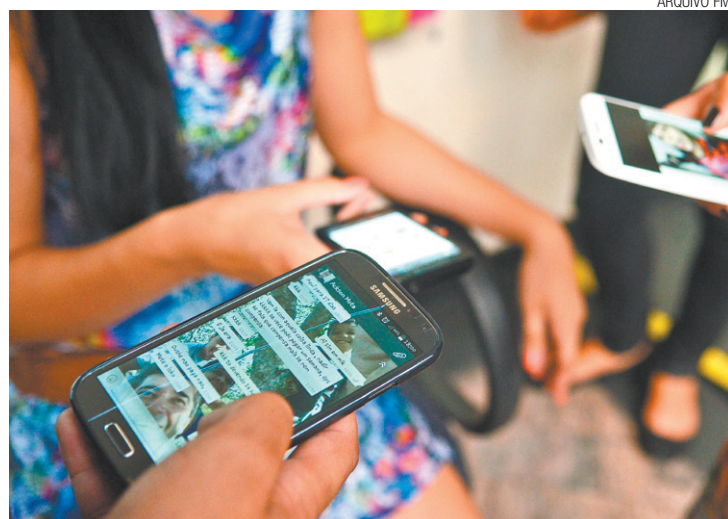
"Vício" - Pesquisa enfoca hábitos questionando motivações na rede

Para professora, pessoas deveriam aproveitar mais o namoro sem celular