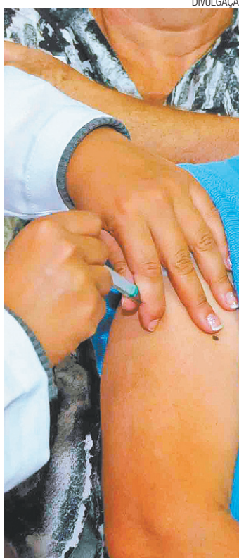
Prevenção - No dia 11 começa a segunda fase da vacinação

Além da vacina, medidas simples como higienizar as mãos e manter os ambientes arejados podem evitar a contaminação pelo vírus da gripe. Outra dica importante é utilizar um lenço para cobrir a boca ao tossir no lugar de usar as mãos. Evite aglomerações e contato com pessoas doentes e não compartilhe copos, talheres ou objetos de uso pessoal. Vale lembrar que se houver sintomas da doença é importante consultar um médico e evitar a automedicação.