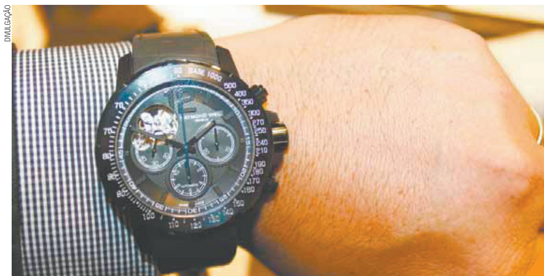
Hora certa - Relógios de pulso servem, muitas vezes, mais como item de luxo do que de informação