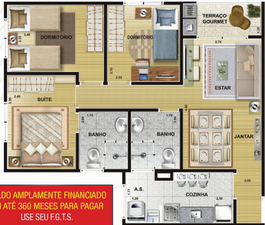
Ilustração artística da planta tipo de 3 dormitórios. Móveis e utensílios de decoração são meramente ilustrativos.

R. ALBERTO HINOTO BENTO, 42 (antiga R. dos Japoneses) MACEDO - GUARULHOS CORRETORES DIARIAMENTE NO LOCAL