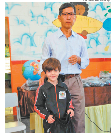
Propaganda - Criança posa ao lado do prefeito usando uniforme escolar