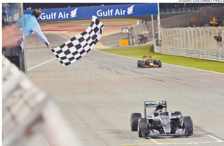
Boa fase - Rosberg cruza a linha de chegada e lidera o campeonato

Coadjuvante desta vez, o tricampeão Hamilton foi o terceiro colocado, atrás do finlandês Kimi Raikkonen, da Ferrari. O brasileiro Felipe Massa cruzou a linha de