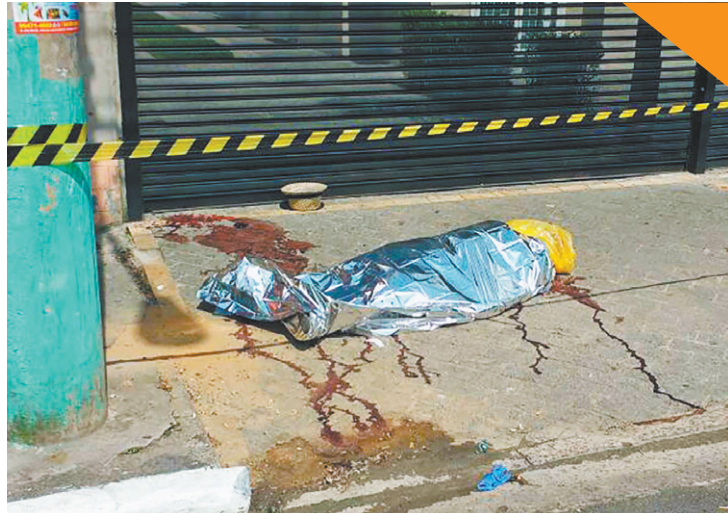
Luto - Homem foi atingido por bala perdida na Zona Leste da Capital