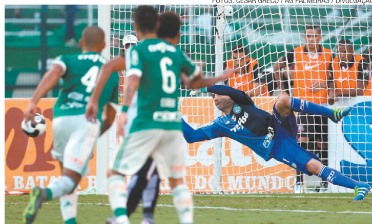
Salvador - Quando o jogo estava empatado, Prass defendeu pênalti

GOL - Dudu, aos 30 minutos do segundo tempo. CARTÕES AMARELOS - Gabriel Jesus, Arouca, Egídio e Alecsandro (Palmeiras); Lucca, Felipe e Giovanni Augusto (Corinthians). ÁRBITRO - Flávio Rodrigues de Souza. RENDA - R$ 644.765,00. PÚBLICO - 21.219 pagantes. LOCAL - Estádio do Pacaembu, em São Paulo (SP).