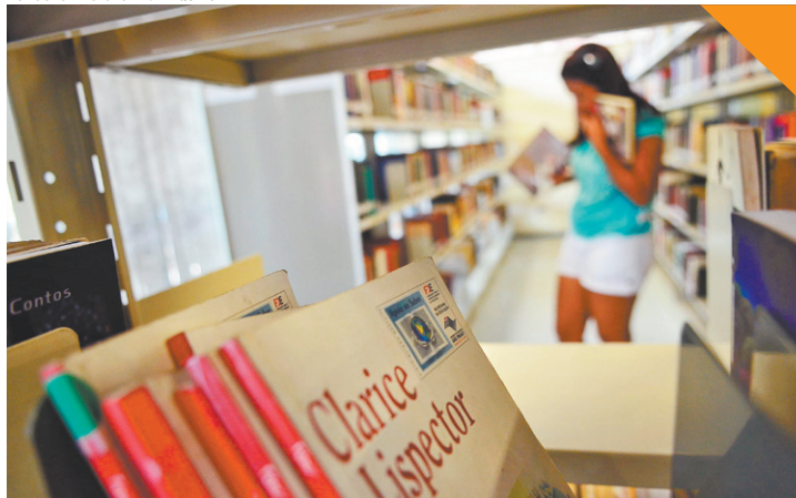
Clássicos - Biblioteca Monteiro Lobato é a campeã de empréstimos