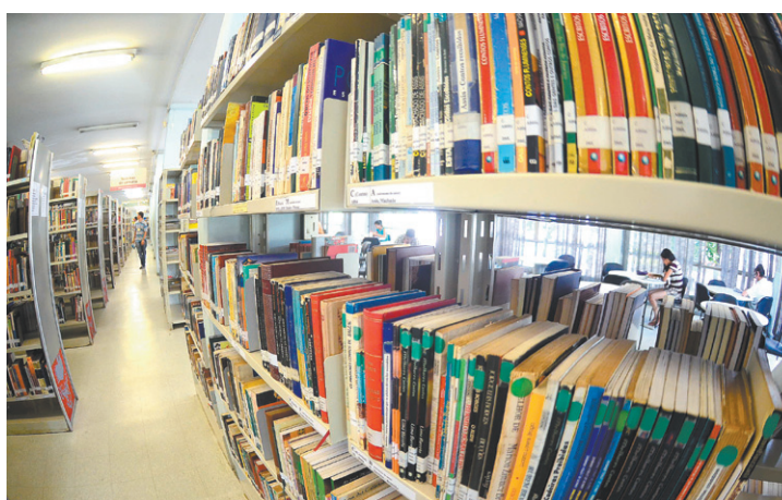
Eclético - Prateleiras estão repletas de livros, para todos os gostos