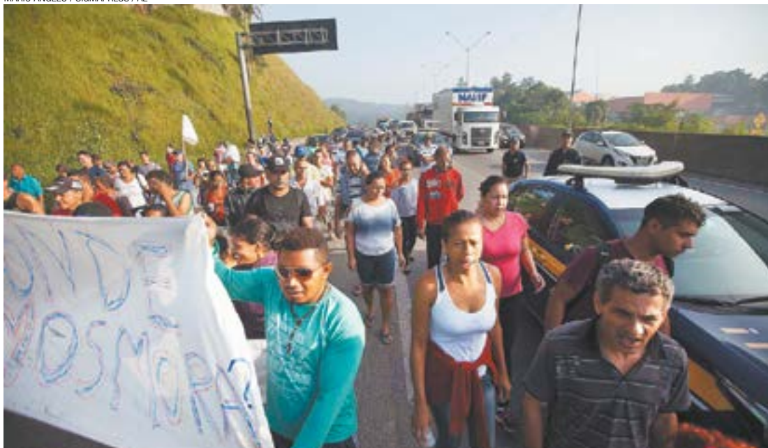
Desapropriação - Grupo de moradores se manifestaram contra ação a ser realizada pela Prefeitura de Guarulhos