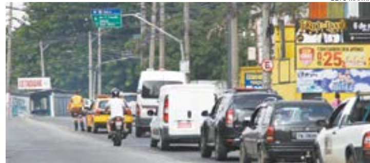
Congestionamento - Trânsito ficou prejudicado na manhã de ontem