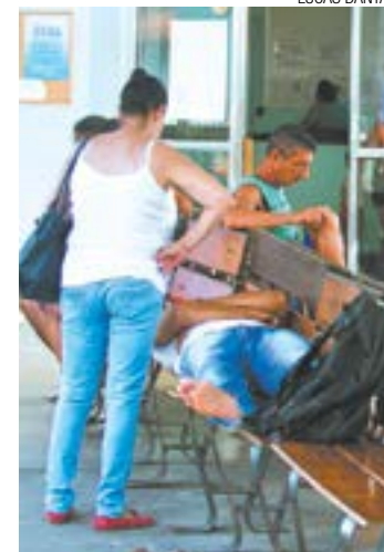
Maca? Paciente aguarda remoção em banco na UPA Maria Dirce

mu que vai regularizar a situação o mais breve possível.