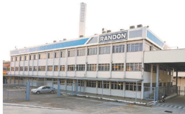
Fechada - Empresa funcionou por 40 anos às margens da Via Dutra

Além disso, a metalúrgica depositou três salários nominais, além da rescisão, e garantiu seis meses de convênio médico e o mesmo período para que os funcionários recebam cestas básicas.