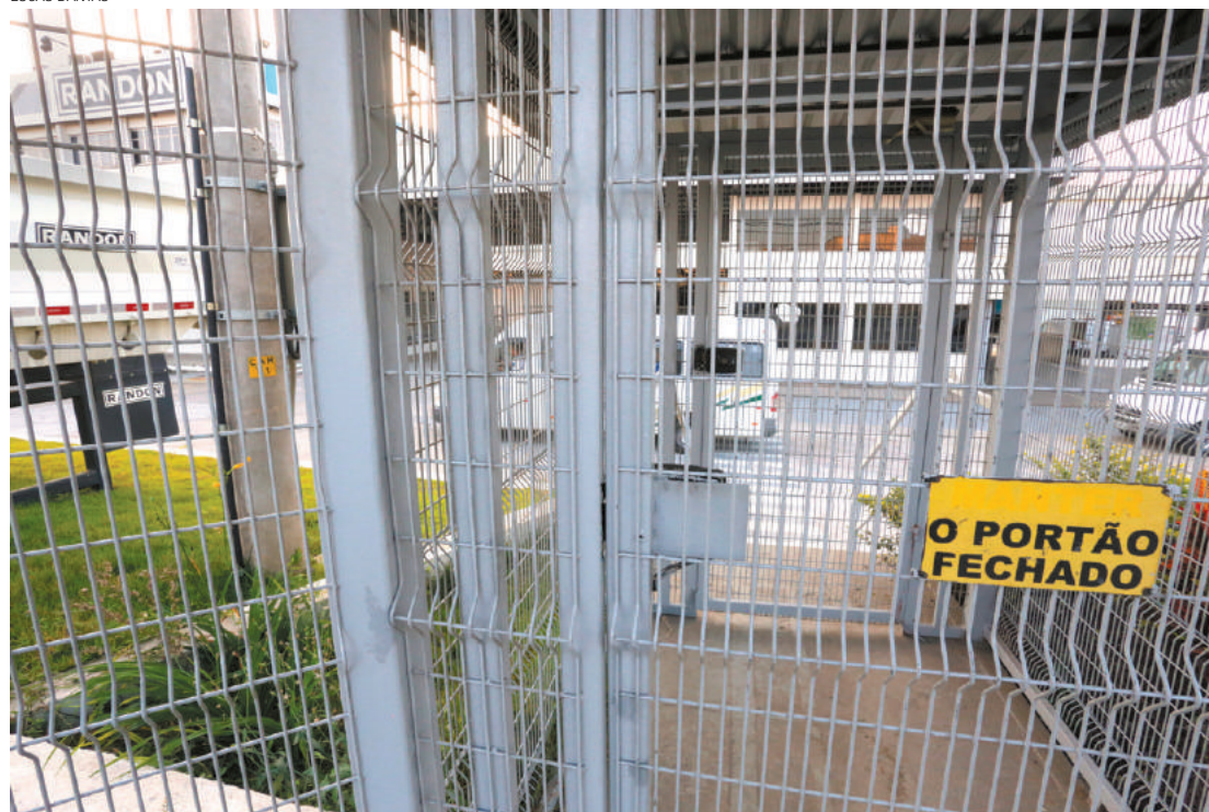
Fim - Empresa vinha reduzindo quadro de pessoal nos últimos anos e acabou fechando de vez em 2016