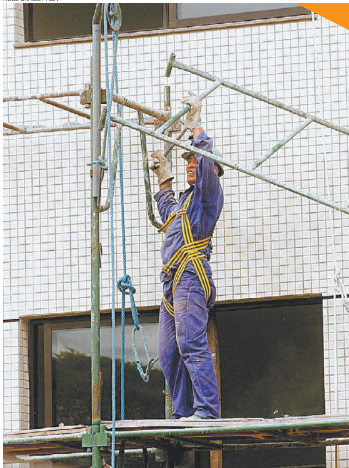
Risco - Afastamento por acidente de trabalho é comum no Estado de SP