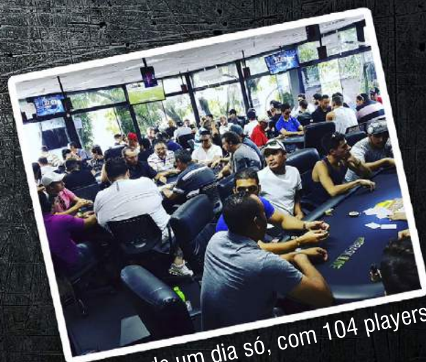
Torneio de um dia só, com 104 players!

Mais uma vez obrigado e aguardamos sua visita.