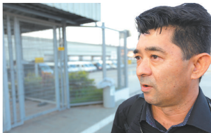
Tristeza - "Muitos pais de família estão sem emprego", disse colaborador