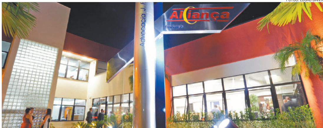
Fachada - Design arrojado é a marca da ampliação e reforma da tradicional sede da nova Aliança Imóveis