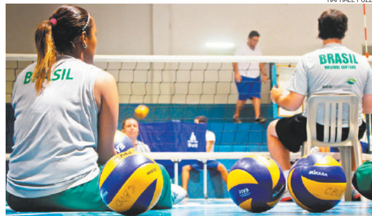
Seleção - Garotas se preparam na cidade para os jogos paralímpicos