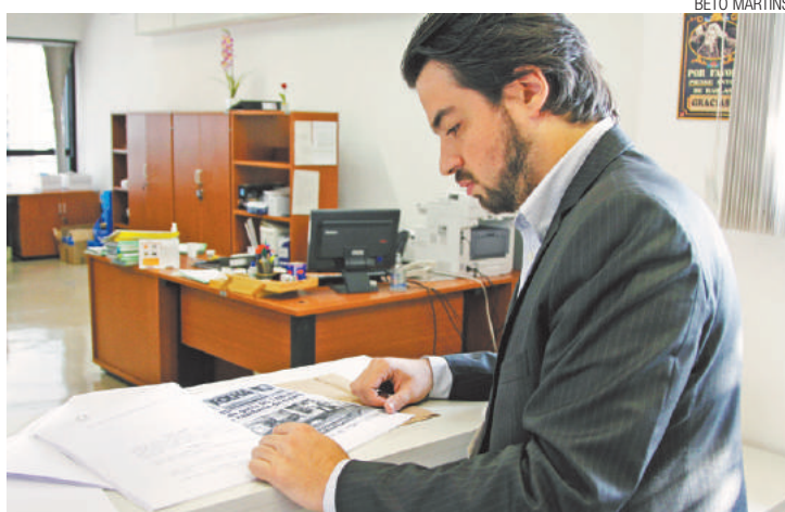
Protocolo - Vereador apresentou ontem representação na sede do MP