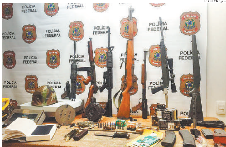
Mandado - Justiça autorizou busca e apreensão em residência de SP

Um mandado de busca e apreensão foi expedido pela Justiça na terça-feira, 12, quando ocorreu a apreensão das armas. O suspeito, com cida-