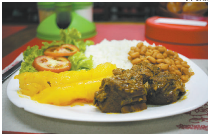
Tradição - Prato feito traz economia, salada, arroz, feijão e "mistura"

Em 2015, o preço médio do comercial e do prato feito na cidade era de R$ 21,01. Este ano, a mesma refeição custa em torno de R$ 23,66. No modelo self-service, o custo subiu de R$ 24,55 para R$ 27,63. Estão incluídos no cálculo bebida, sobremesa e