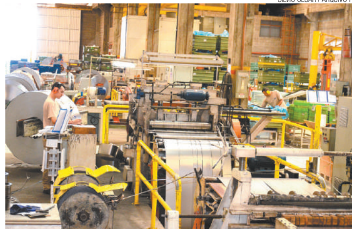
Fugindo - Empresas estão saindo de Guarulhos para diminuir efetivo