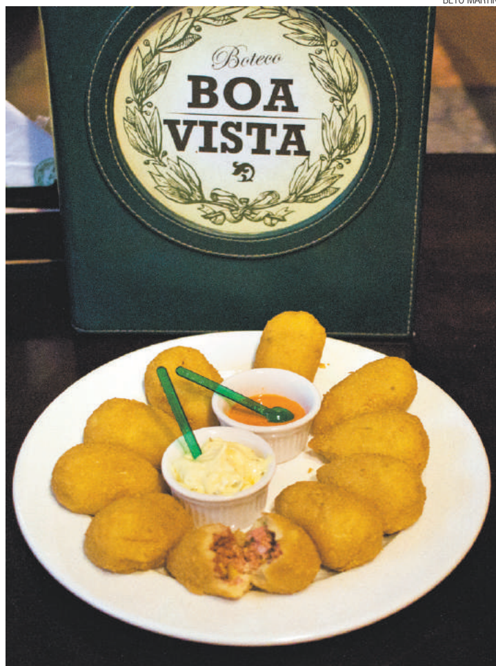
Humm - Salgado foi incluído no cardápio no fim de 2015 e veio para ficar

Porém, há males que vem para bem. As vendas do bolinho aumentaram assim que coxinhas e pães com mortadela se tornaram referências pejorativas para designar os “dois lados” da moeda política brasileira atual.