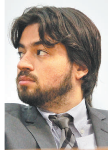
Propostas - Pré-candidato foca debate na solução de problemas

discutindo todas as áreas da municipalidade, já estão agendadas e acontecerão periodicamente, para que as reflexões dos encontros resultem em novas soluções para as políticas públicas de Guarulhos.