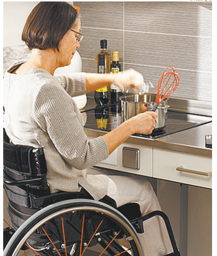
Mobilidade - Cozinha adaptada facilita atividades e ajuda na inclusão

Independente da dificuldade é possível viver em uma casa de dois andares ou em apartamentos altos. "Edificações verticais foram alvo de estudos e investimentos e a tecnologia tratou de baratear o preço de plataformas elevatórias, além dos meios mecânicos existem as rampas que resolvem o problema dos deslocamentos verticais", finalizou Borzani.