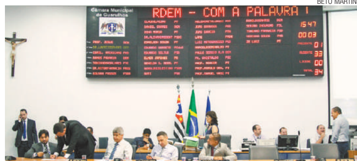
Ausências - Sessão foi encerrada, novamente, por falta de quórum

UNG UNIVERSIDADE ser educacional pos.ung.br /UNGUniversidade