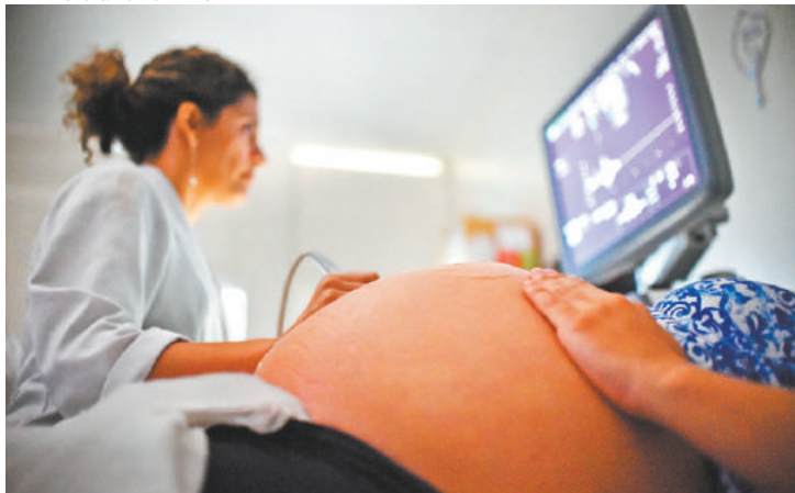
Atenção - Gestantes com suspeita de microcefalia têm erupção cutânea