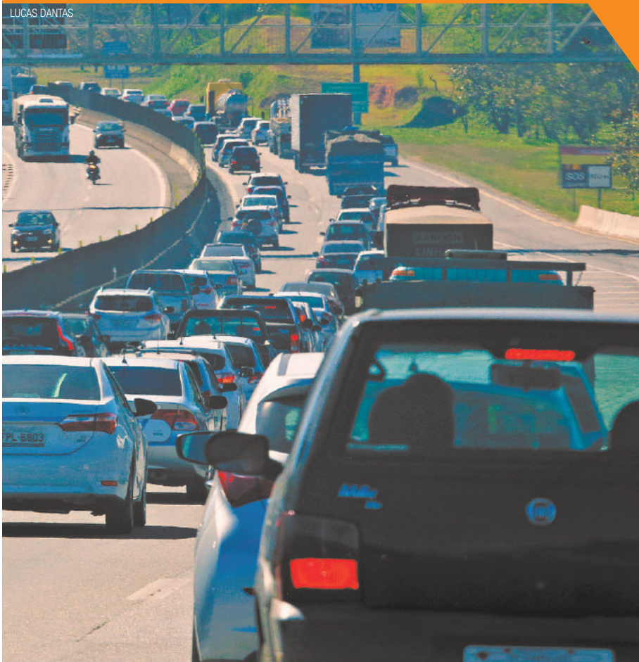
Feriadão - Movimento na Via Dutra, em Guarulhos, ficou intenso no início da tarde de ontem