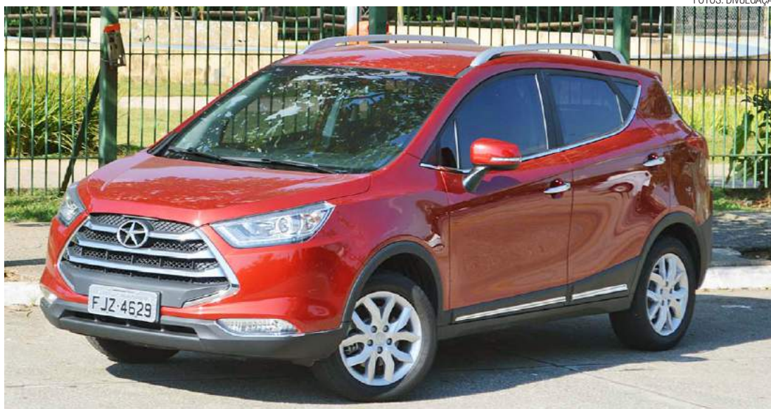
Moderno - Novo JAC T5 conta com motor 1.5 16V VVT JetFlex, equipado com câmbio manual de 6 marchas

De acordo com o Inmetro, o T5 está entre os modelos mais econômicos de sua categoria: 6,80 km/l na cidade e 9,63 km/l na estrada (etanol) ou 8,18 km/l e 12,2 km/l (gasolina). Os números foram confirmados na avaliação.