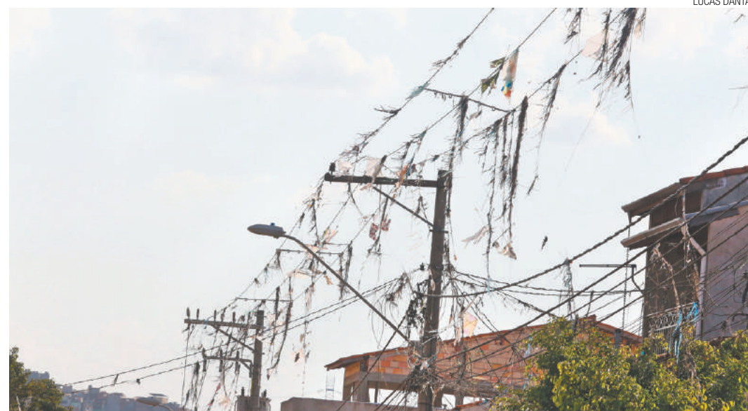
Lixo - Há várias formas de exercer a cidadania; uma das mais importantes é evitar a poluição, inclusive nos fios