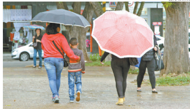
Agasalhos - Casacos e guarda-chuvas começaram a sair do armário ontem