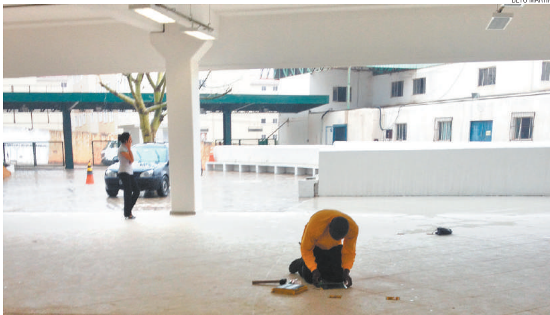
Inacabado - Operários seguem trabalhando no pátio e em várias salas de aula do novo bloco da universidade

Ainda não se sabe ao certo como será feito a reposição de aulas. Está sendo discutido qual será a melhor forma de recuperar os dias perdidos. Em nota, a instituição afirmou que a “Câmara de Graduação do Campus Guarulhos e o Conselho de Graduação da Unifesp discutirão a reformulação do calendário, contemplando as reposições de aulas”.