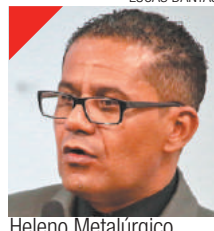
Heleno Metalúrgico PDT