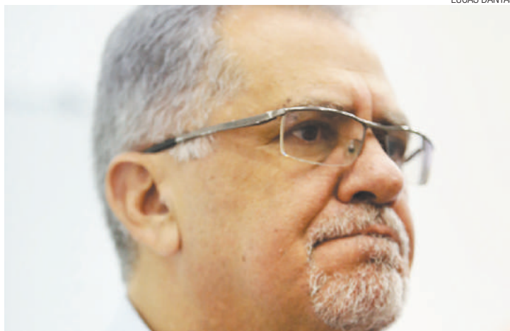
Traição? Vereadores da base ainda não garantiram apoio para Almeida

“Nós temos que avaliar se efetivamente ocorreu ou não o crime de improbidade, mas até agora nenhuma