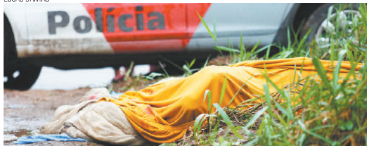
Violência - Durante seis dias, ao menos 11 foram mortos em Guarulhos