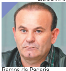
Ramos da Padaria DEM