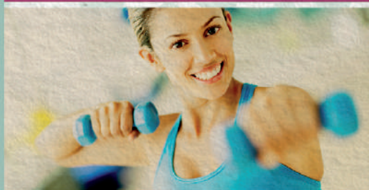
Sorteio 29/5 1 ANO DE ACADEMIA