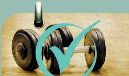
Sorteio 7/4 1 ANO DE ACADEMIA