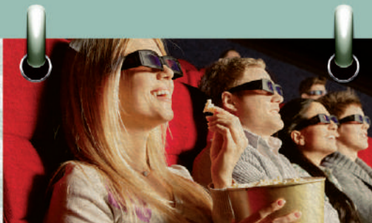
Sorteio 1/5 1 ANO DE CINEMA