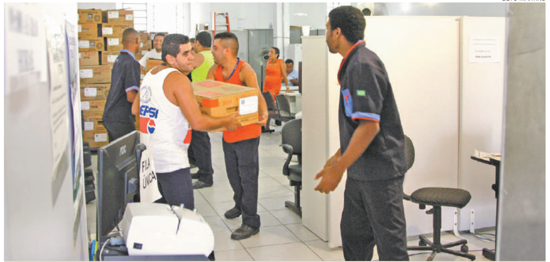
Ordem de despejo - Cartório da Vila Galvão foi desativado após inadimplência de quatro meses no aluguel

A Folha Metropolitana chegou a questionar a Caixa Econômica Federal e o setor de comunicação do Executivo Municipal, mas até o fechamento desta reportagem não recebeu resposta sobre as acusações do vereador.