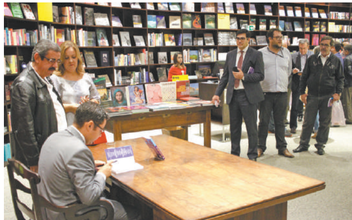
Lançamento - Livro de 320 páginas está disponível em todo o País