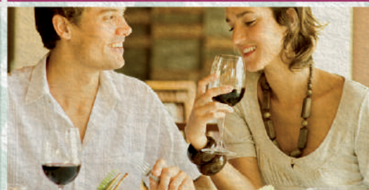
Sorteio 22/5 1 ANO DE RESTAURANTE

PRESENTES QUE VÃO FAZER OS SEUS AMORES LEMBRAREM DE VOCÊ O ANO INTEIRO.