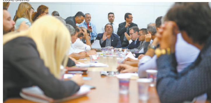
Pressa - Comissão precisa apresentar relatório dos trabalhos até 5 de maio