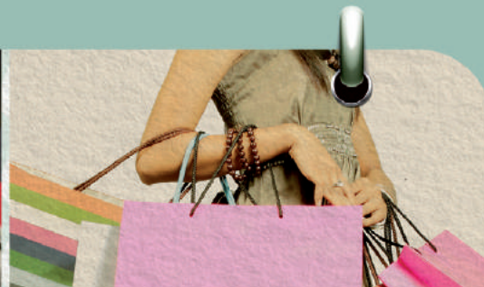
Sorteio 8/5 1 ANO DE COMPRAS