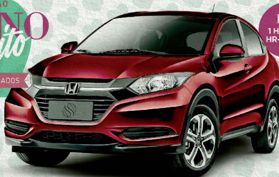
12/6 1 HONDA HR-V OKM

PROMOÇÃO UM ANO Perfeito MÃES & NAMORADOS