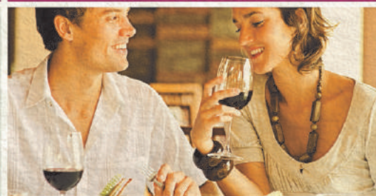
Sorteio 22/5 1 ANO DE RESTAURANTE

PRESENTES QUE VÃO FAZER OS SEUS AMORES LEMBRAREM DE VOCÊ O ANO INTEIRO.