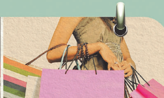
Sorteio 8/5 1 ANO DE COMPRAS