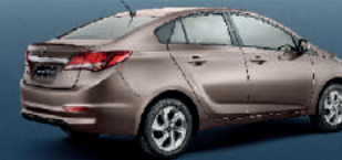
HB20S 1.0 Turbo

Motor 1.0 Turbo de 105 cv e 15,0 kgfm. Potência e torque de motores maiores (1.3, 1.4 e 1.5) com baixo consumo de combustível.