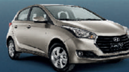
HB20 1.0 Turbo