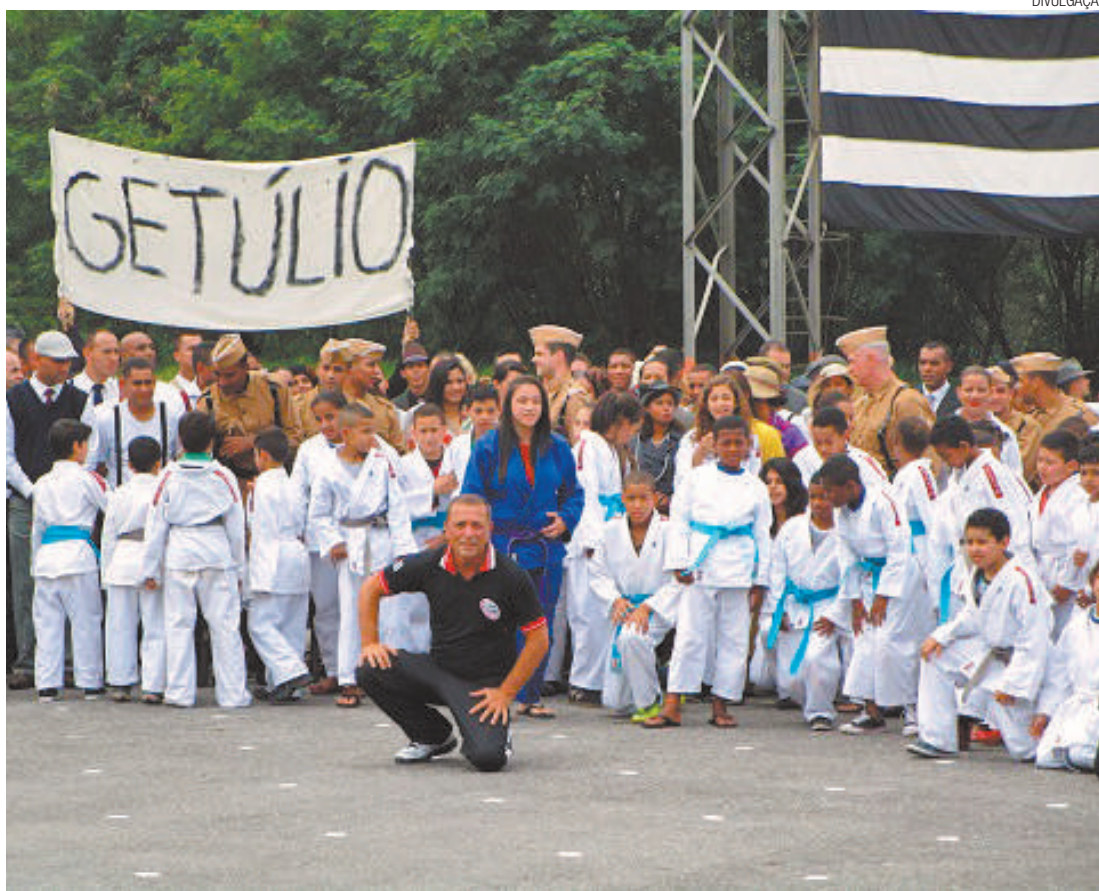
Equipe - Atletas arujaenses disputaram as categorias pré-juvenil, juvenil, meio-médio, leveiro e master

Atualmente, o Promesp tem 50 alunos que praticam a modalidade gratuitamente no Ginásio Municipal Mario Covas, no Parque Rodrigo Barreto.