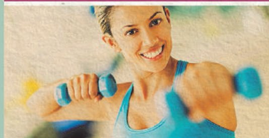
Sorteio 29/5 1 ANO DE ACADEMIA