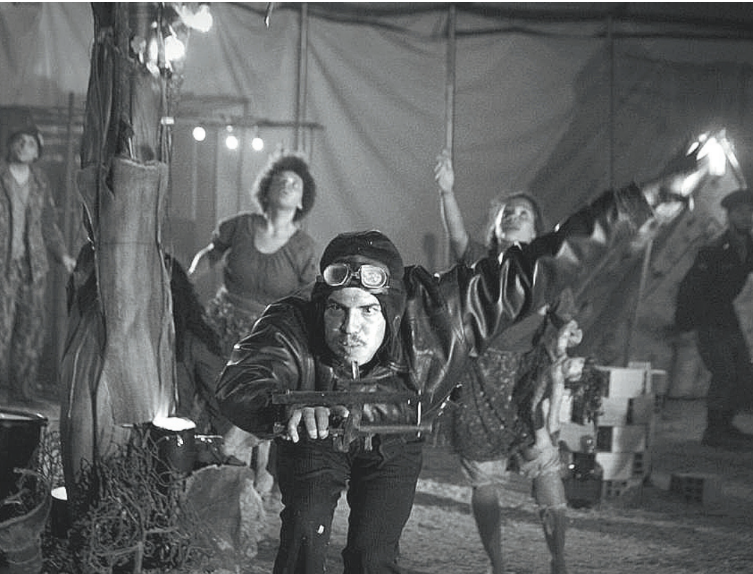
Teatro - Num campo de prisioneiros de guerra: segredos, violência, lutas e a busca pela sobrevivência