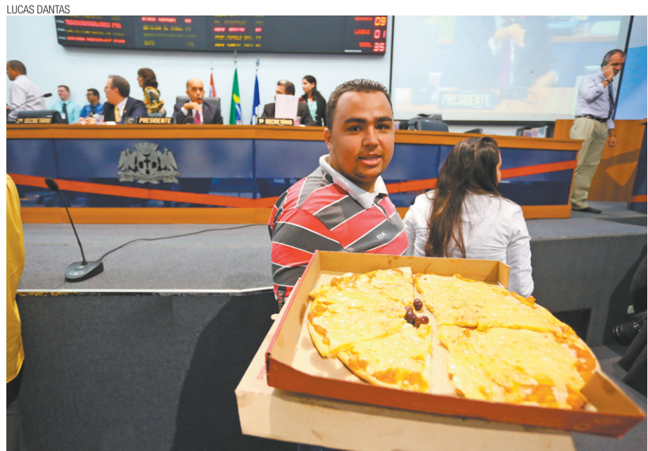
À moda - Prefeiturável pelo PSB pediu a assessores para servirem pizza aos vereadores