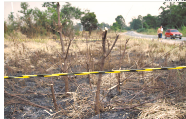
Invasão perigosa - Demarcações foram feitas bem perto do asfalto

Em nota, a Secretaria de Finanças informou que a área