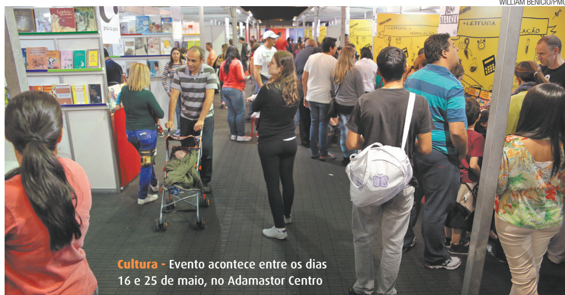
Cultura - Evento acontece entre os dias 16 e 25 de maio, no Adamastor Centro