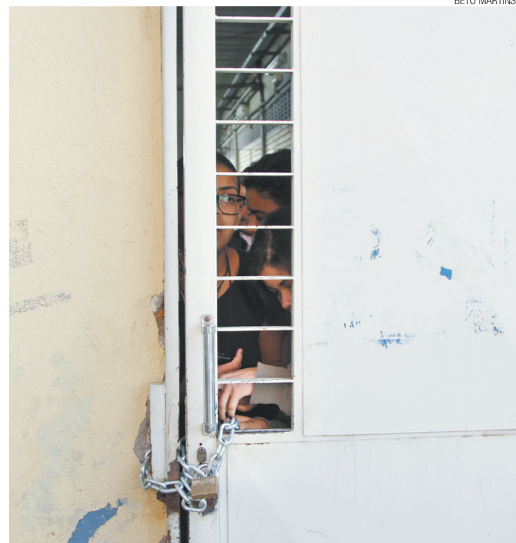
Pressão - Alunos querem gestão mais democrática nas escolas do Estado