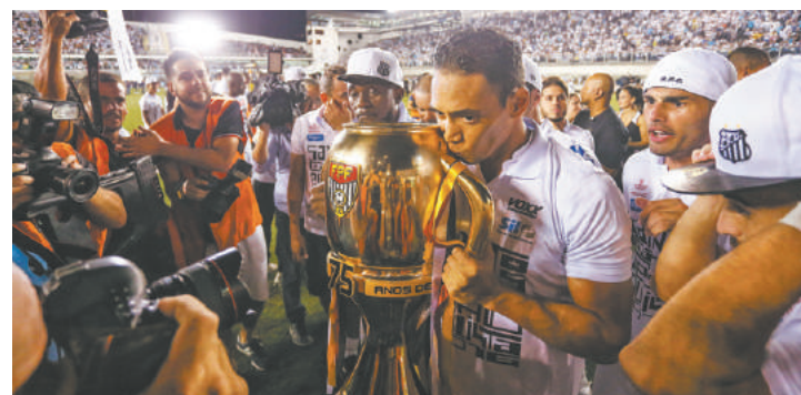
Decisivo - Atacante e artilheiro do Peixe, Oliveira beija a taça do Paulistão