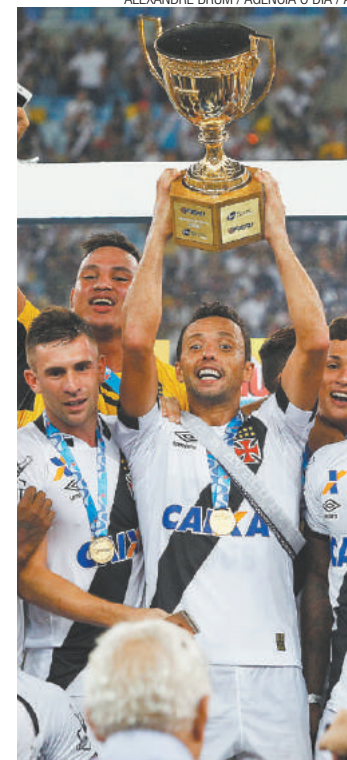
É campeão - Capitão da equipe levanta a taça e solta o grito