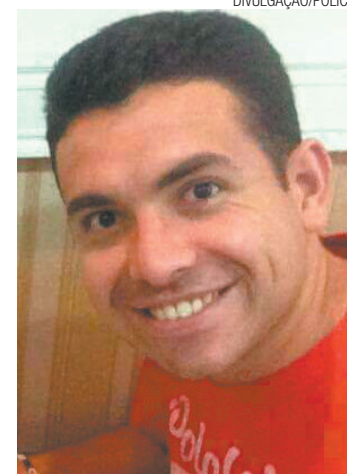
Foragido - Caso reconheça o suspeito, denuncie à polícia