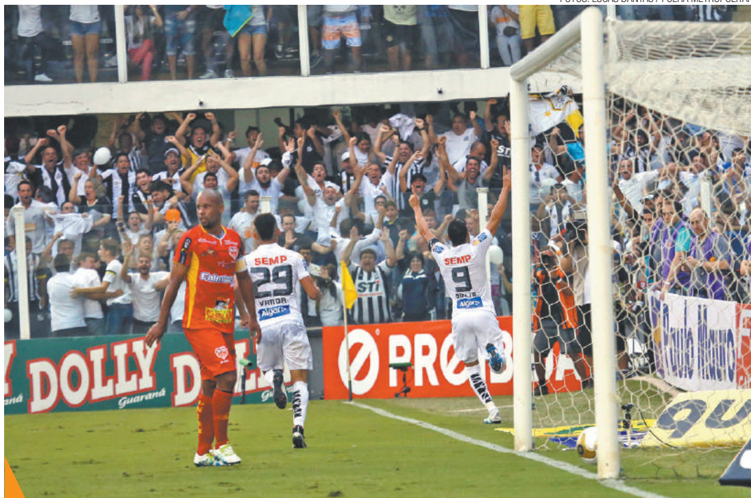
Matador - Ricardo Oliveira comemora golaço que garantiu a vitória e o bicampeonato ao Santos