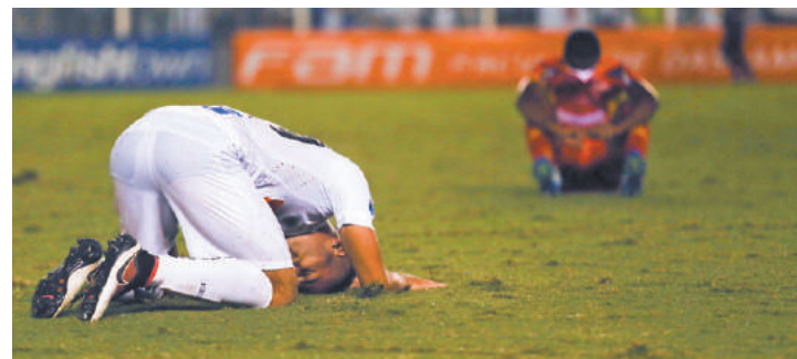
Graças - Santista desaba no gramado e faz reverência após o apito final