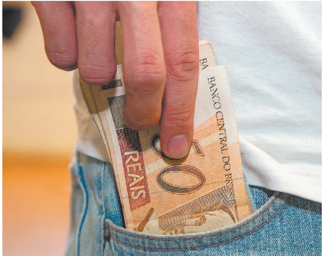
Dinheiro no bolso - Restituição do Imposto de Renda pode servir para pagar contas inesperadas no mês

Quando você faz a declaração do imposto de renda, o programa faz as contas e, caso você tenha muitas deduções (como dependentes, despesas médicas ou com educação, por exemplo), o próprio programa já vai dando os descontos proporcionais. No fim das contas, dependendo de quanto você gastou, pode ser que tenha dinheiro a receber, ou seja, a restituir.