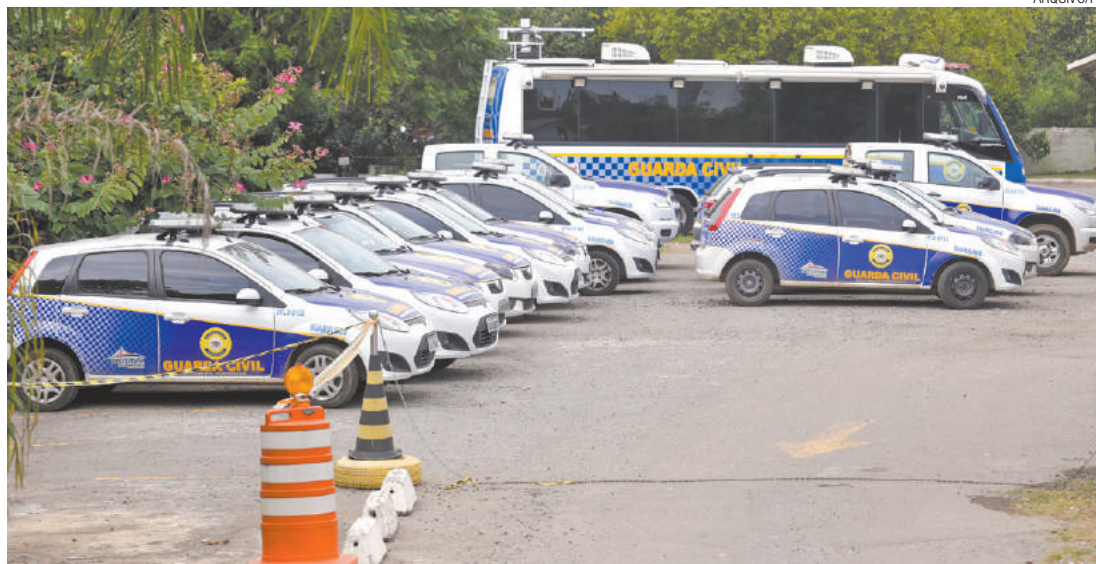
Paradas - Viaturas da guarda fotografadas em 4 de agosto de 2015 no pátio de um dos prédios da corporação

Guarda teria pago R$ 30 do próprio bolso para conseguir atender a uma ocorrência