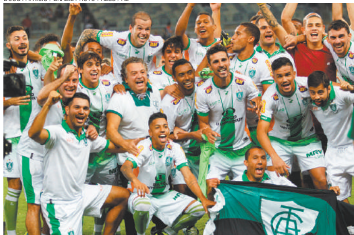
Longa espera - Jogadores do América-MG vibram após 15 anos de jejum