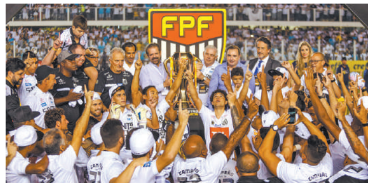
Glória - Equipe faz agradecimento coletivo levantando a taça de campeão