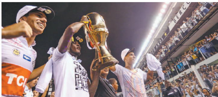
Saudação - Jogadores exibem o troféu aos torcedores que lotaram a Vila Belmiro