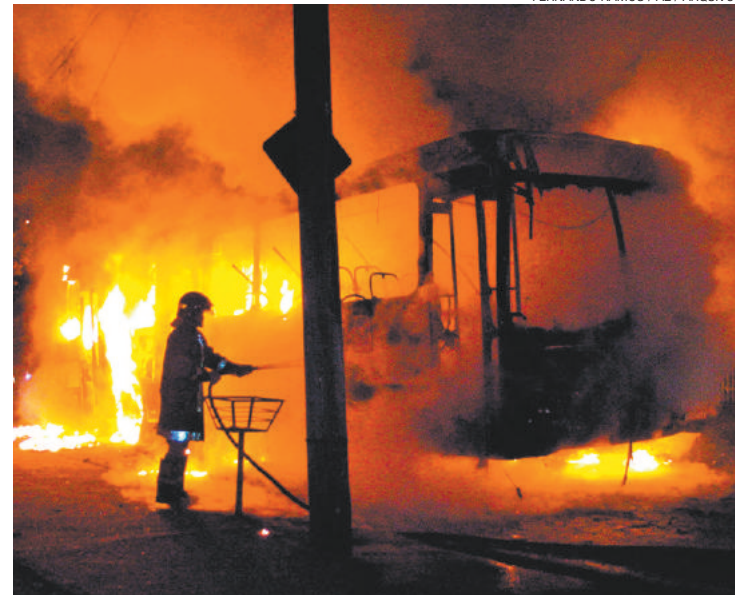
Terror - Vários ônibus foram incendiados nos atentados do PCC em SP

Os ataques ocorreram após a transferência da cúpula da facção para um presídio de segurança máxima, no interior do Estado. Esta versão é questionada por