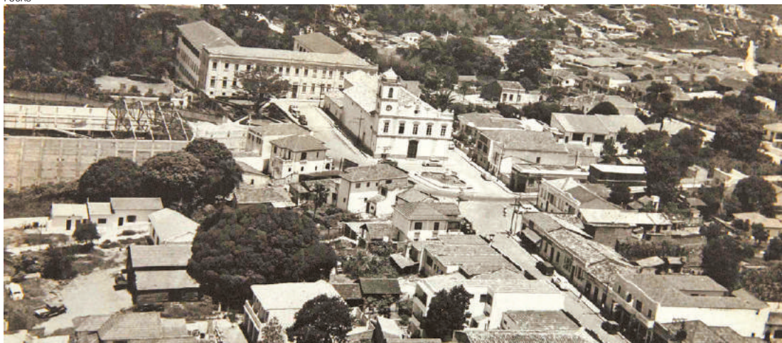
Passado distante - Imagem mostra Centro histórico, com Igreja Matriz, lojas nos arredores e muitas árvores