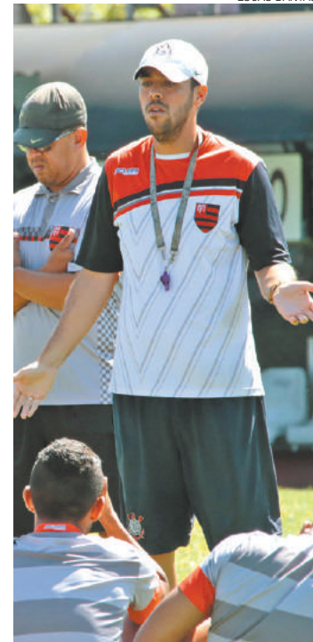
Marelli - “Vamos tentar conquistar um ponto fora de casa”

“No ano passado foi assim também. Três times da semifinal estiveram conosco na fase de grupos”, disse. Mesmo assim, pela primeira vez, a equipe chegou ao estágio. O Corvo só não chegou à final pois perdeu para o Corinthians por 1 a 0. De acordo com o técnico, a experiência de 2015 pode interferir na campanha desse ano. “Temos poucos remanescentes, mas eu aprendi muito no ano passado. Agora é colocar em prática”, disse.