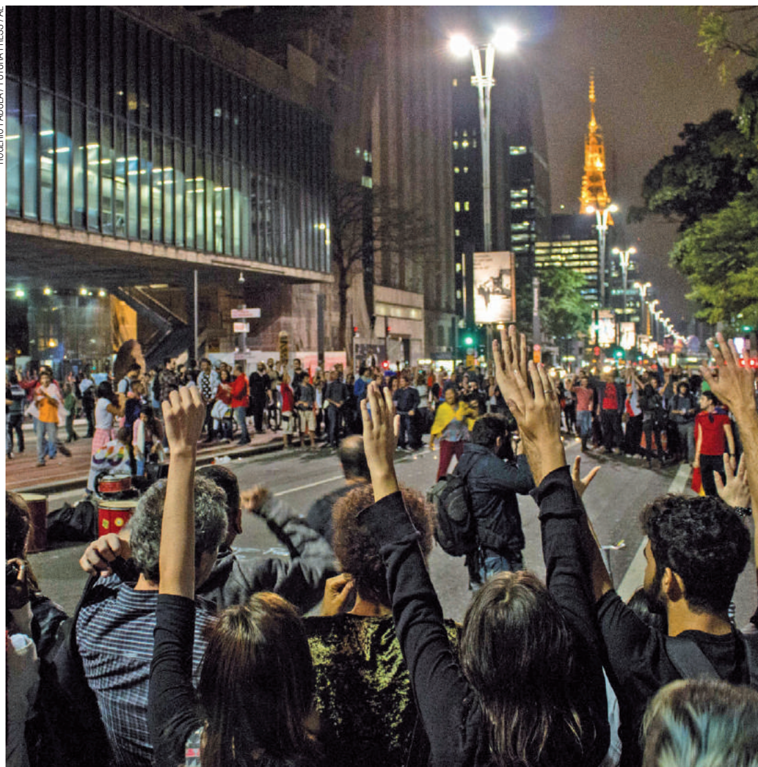
Confusão - Grupos pró e contra a presidente Dilma Rousseff trocaram provocações, ontem, na Avenida Paulista

O impeachment teve o apoio de senadores que integraram o primeiro escalão dos governos petistas desde 2003. Os aliados do passado fizeram discursos vacinados contra questionamentos de incoerência ideológica. Um deles foi Cristovam Buarque (PPS-DF), demitido por Lula em 2004.