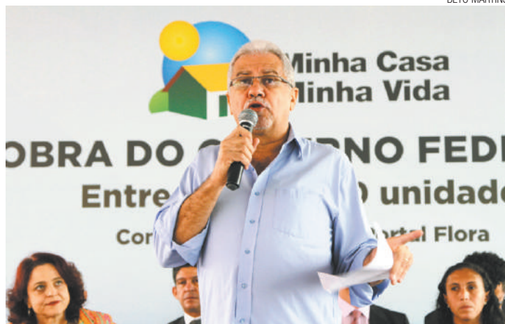
Morada - Almeida entregou apartamentos ontem em Bonsucesso

De acordo com decisão do Supremo Tribunal Federal (STF), todos os precatórios, dívidas já debatidas na Justiça, que no caso do Saae estão em torno de R$ 1,3 bilhão, devem ser quitados em um prazo limite de até cinco anos.