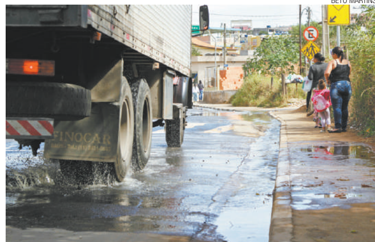
Mau cheiro - Avenida virou incômodo para pedestres e motoristas

"É sempre assim, desde novembro, toda vez que chove a rua fica com esse cheiro ruim. Eu acabei de atravessar a rua para não correr risco de ser molhada", disse Débora