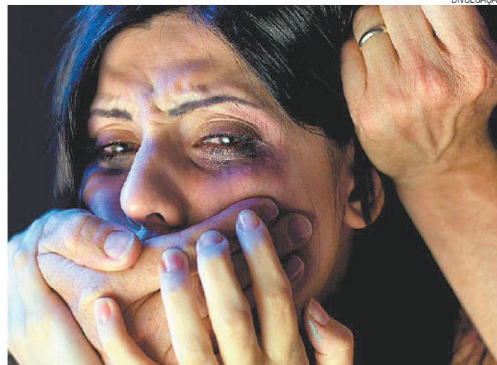
Sofrimento - Mulheres são as principais vítimas de estupro no mundo