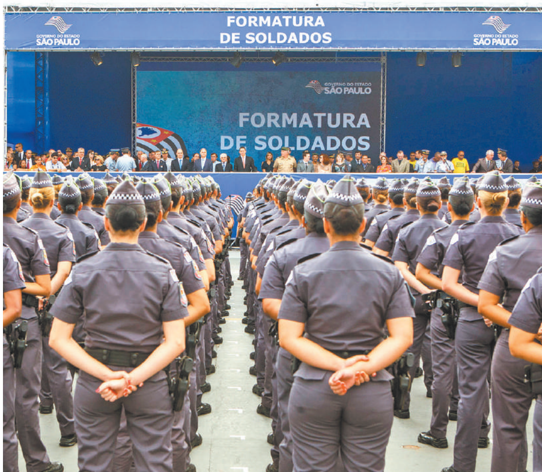
Futuro sombrio - Formatura de policiais militares; muitos, infelizmente, podem ficar sujeitos a transtornos