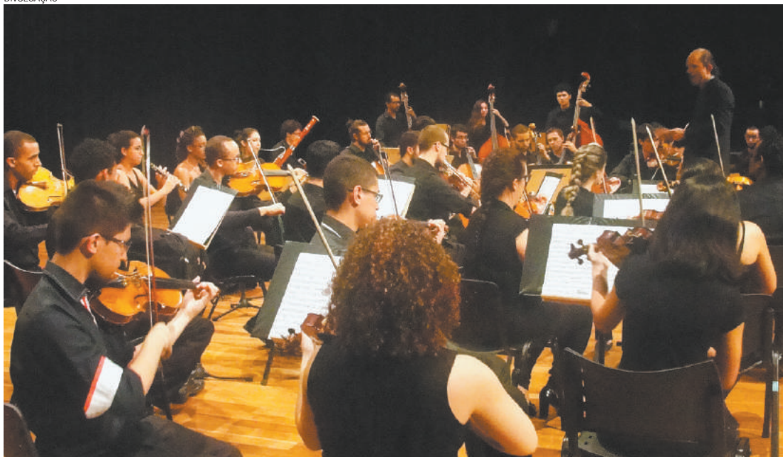
Concerto - A entrada é gratuita e os ingressos devem ser retirados na bilheteria com duas horas de antecedência