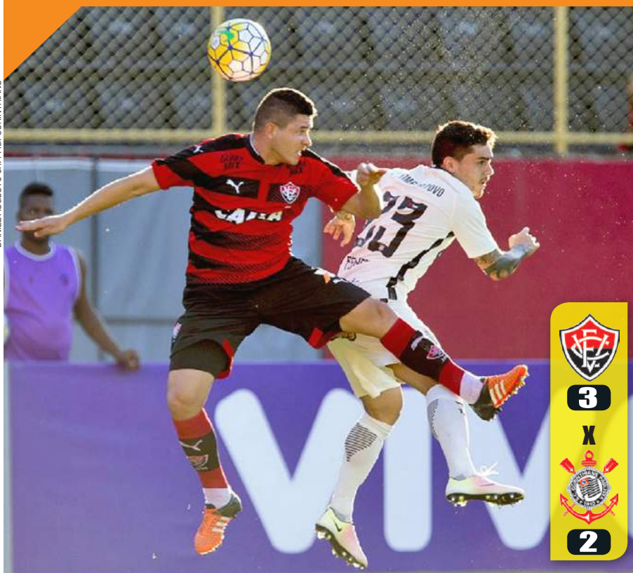
Mais um tropeço - Corinthians perde de virada para o Vitória e amplia a má fase da equipe

“É um lugar bacana, mas muito perigoso”, Moradora do Lago dos Patos, na Vila Galvão, que não quis se identificar à reportagem