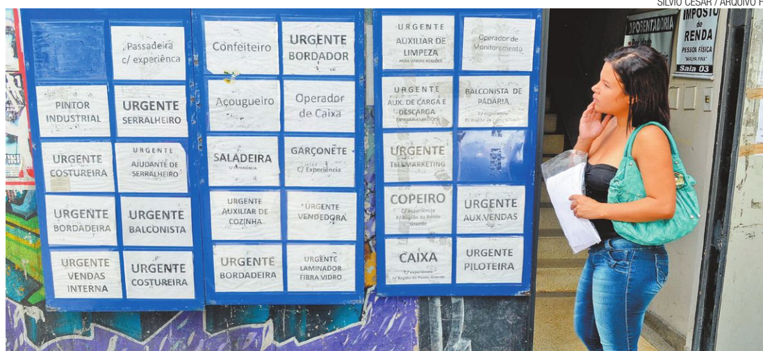
Estatística - Somente em abril deste ano, 53 vagas sumiram do estoque de emprego no município

Para buscar um cenário positivo, Burti acredita ser necessário recuperar a confiança do consumidor. "Acreditamos que, até o final do ano, de forma gradual, o comércio pare de cair e comece a sinalizar uma recuperação, que só deverá vir no ano que vem", disse.