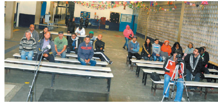
Política - Medida inédita permite discussão popular da peça orçamentária

A LDO trata de metas e prioridades da administração municipal e orienta a elaboração do orçamento anual do município. Arujá, conforme previsão do Executivo, vai ter