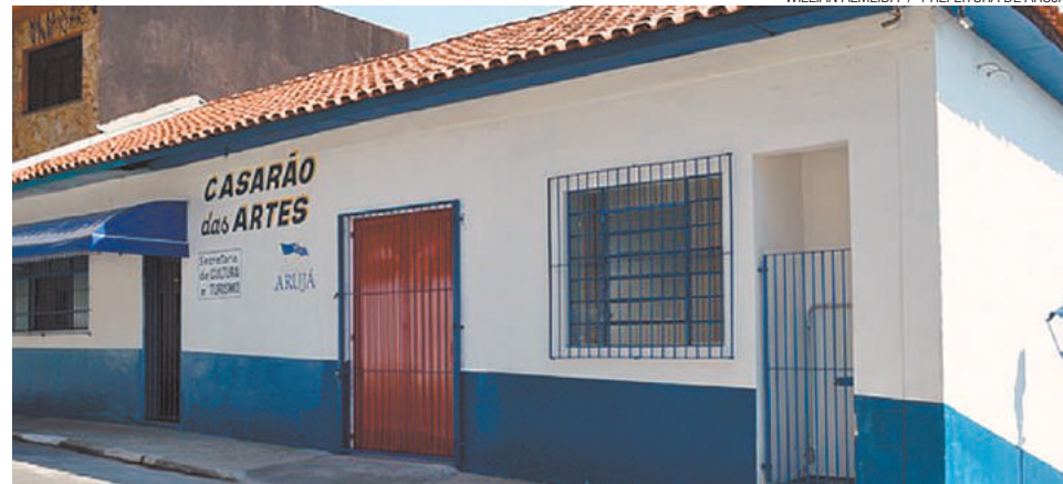
Cinema - Sessões são destinadas a adultos e crianças; espaço fica na Rua Rodrigues Alves, 90, Centro

As sessões são destinadas ao público adulto e infantil e os filmes são exibidos mediante agendamento que pode ser feito na Rua Rodrigues Alves, nº 90, Centro, ou pelo telefone 4651-1261.