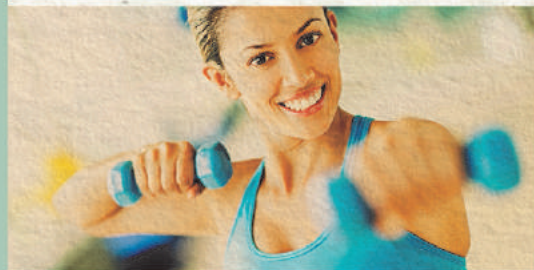
Sorteio 29/5 1 ANO DE ACADEMIA