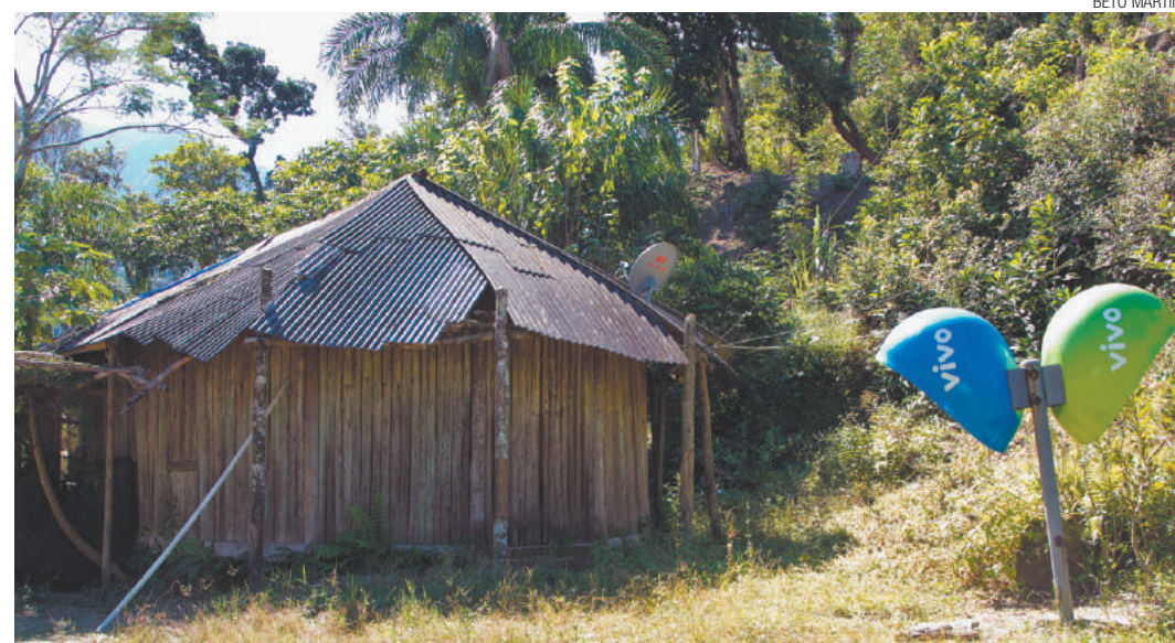
Tempos modernos - Antena de TV a cabo e orelhões contrastam com cabana na Reserva indígena Rio Silveiras