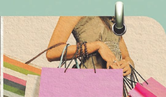
Sorteio 8/5 1 ANO DE COMPRAS