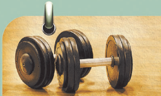
Sorteio 24/4 1 ANO DE ACADEMIA