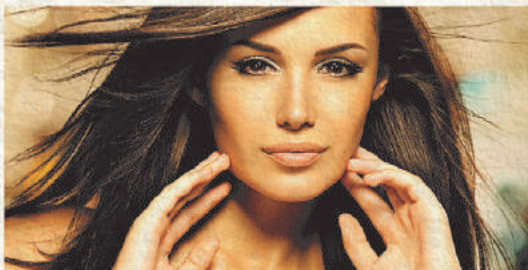
Sorteio 5/6 1 ANO DE SALÃO DE BELEZA

SORTEIOS SEMANAIS. VOCÊ CONCORRE EM TODOS ELES ATÉ O FINAL DA PROMOÇÃO.