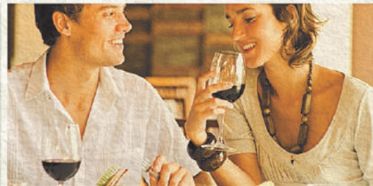
Sorteio 22/5 1 ANO DE RESTAURANTE

PRESENTES QUE VÃO FAZER OS SEUS AMORES LEMBRAREM DE VOCÊ O ANO INTEIRO.