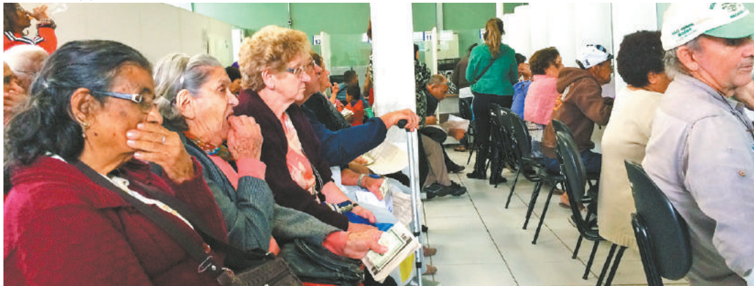
Paciência - Tempo de espera entre a chegada e a retirada do medicamento levou, em média, 2h30 ontem