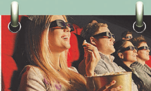
Sorteio 1/5 1 ANO DE CINEMA