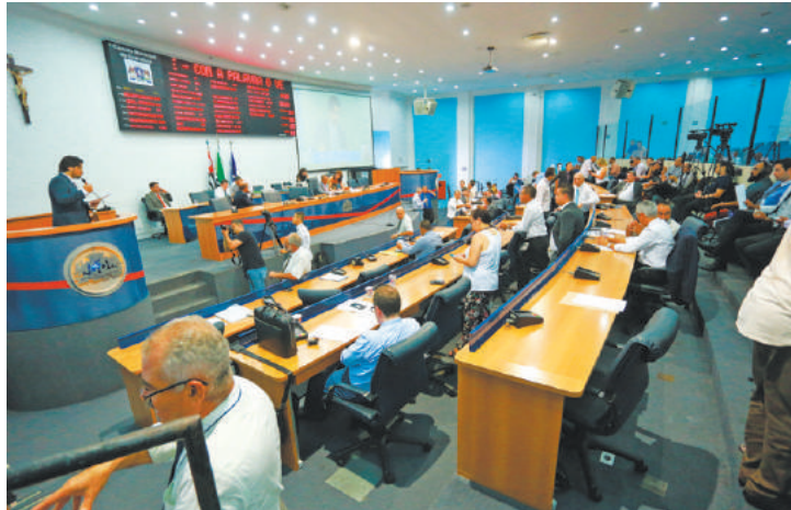
Inchaço - Gasto com mais vagas no plenário superaria R$ 200 mil por mês