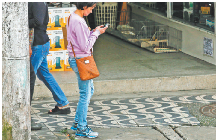
Medo - Pessoas que utilizam os celulares na rua são alvos potenciais

Vítimas denunciaram à reportagem que, na Rua José Maurício, em frente ao Fórum, há um suspeito que