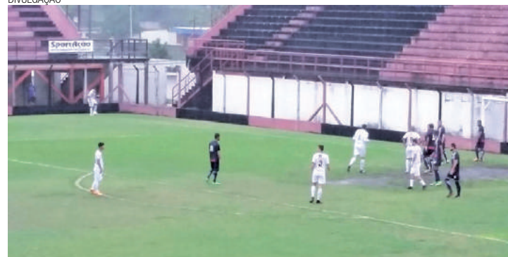
3 a 2 - Guarulhos anotou o 3º gol aos 15 minutos do segundo tempo