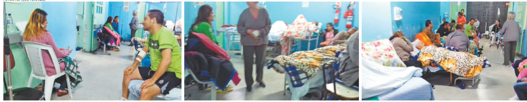
Flagra - Secretaria Municipal de Saúde negou que cadeiras fossem utilizadas como leitos. As imagens, entretanto, mostram que a versão oficial é uma grande mentira e desrespeito aos guarulhenses atendidos