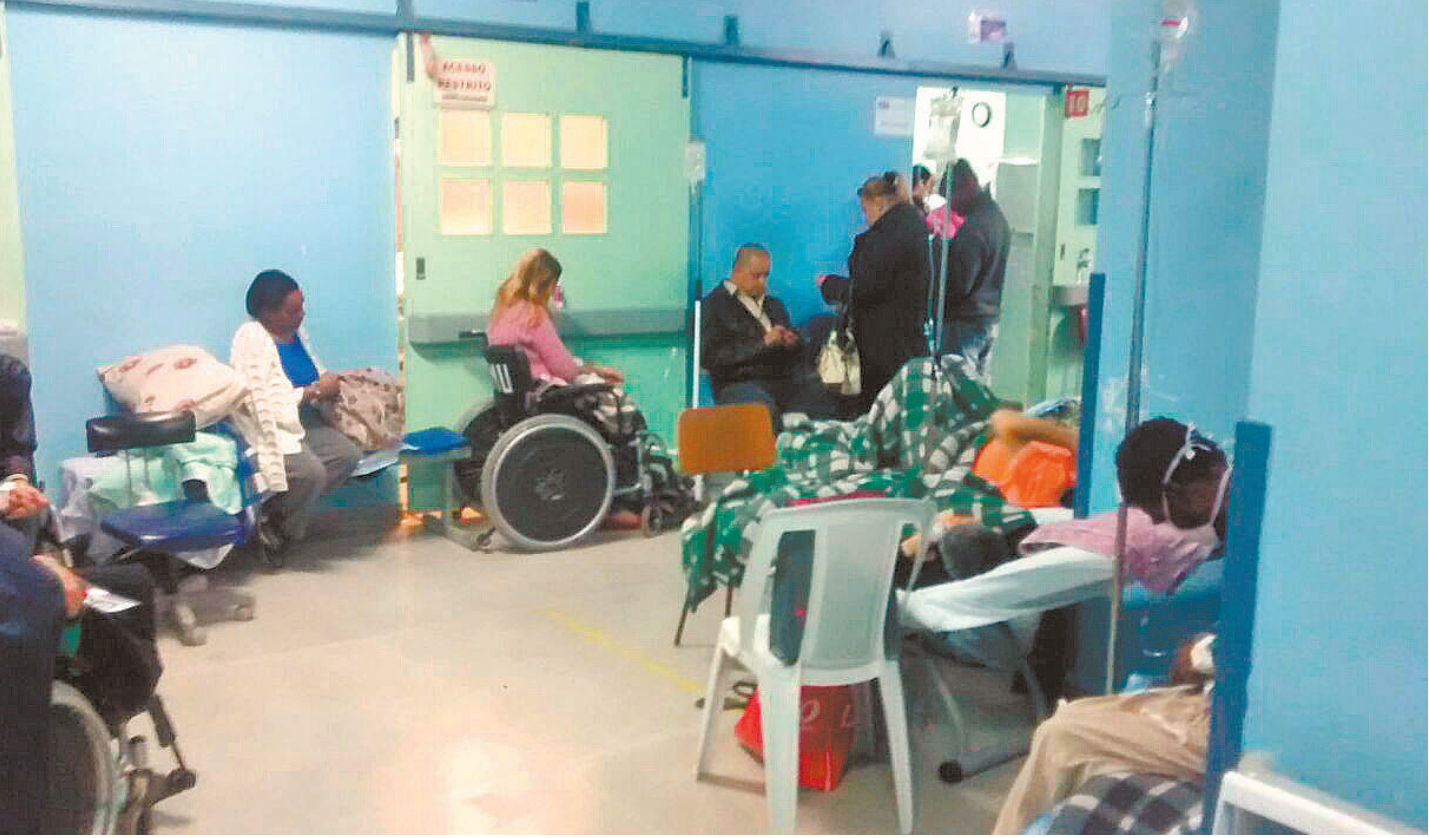
Desespero - Hospital Municipal de Urgências estava com as dependências abarrotadas de pacientes que esperavam atendimento e dignidade

A área onde a FM esteve deveria ser uma sala de espera, mas, segundo apurado, é usada como quarto de internação desde a desinfecção do HMU, em julho do ano passado, feita por causa da existência no local de uma bactéria super resistente. Quatro pessoas morreram na ocasião.