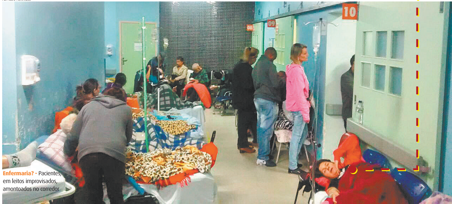
Enfermaria? - Pacientes, em leitos improvisados, amontoados no corredor

“ Às vezes uma mulher precisa fazer xixi e não havia nenhuma privacidade”, Paciente anônima no HMU