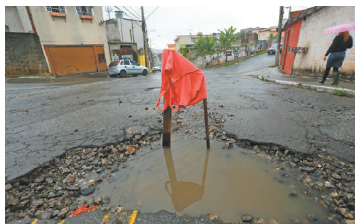
Sinalizado - Na Estrada dos Morros há um buraco no meio da via