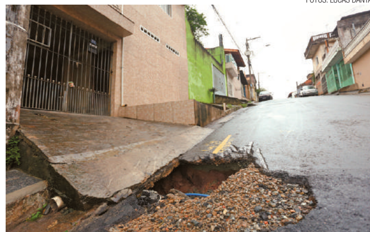
Obstáculo - Cratera impede que veículo tenha acesso à garagem

Saae afirma que vai fechar um dos buracos