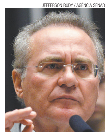
Na mira - Calheiros tentou impedir a reeleição de Janot na Procuradoria

Ao deixar a reunião do Conselho Superior do Ministério Público Federal ontem, Rodrigo Janot não quis comentar o envio ao Supremo de pedidos contra membros da cúpula do PMDB. "Não confirmo nada", disse o procurador-geral da República.