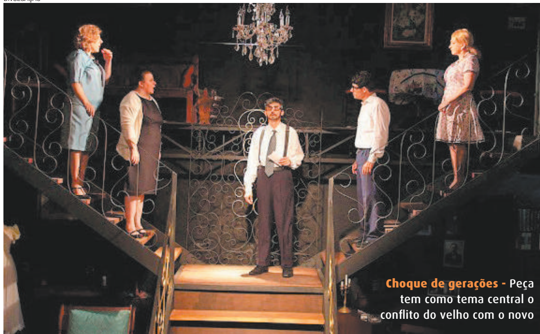
Choque de gerações - Peça tem como tema central o conflito do velho com o novo