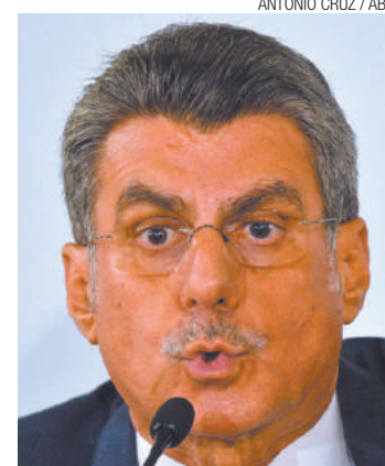
Flagra - Em conversa divulgada, Jucá defendeu fim de investigações