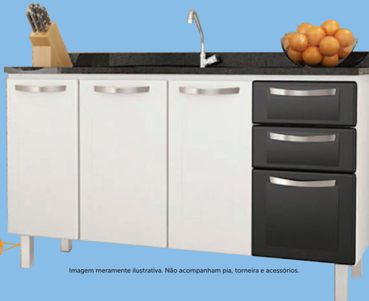
Imagem meramente ilustrativa. Não acompanham pia, torneira e acessórios.