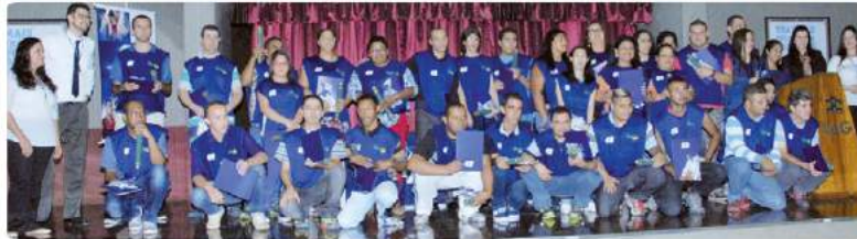
Aprendizes em festa: formação para o mercado de trabalho.

O CIEE promoveu, na Universidade Guarulhos (UnG), a formatura de aprendizes da Bauducco. Foram contemplados com diplomas 37 jovens com deficiência que