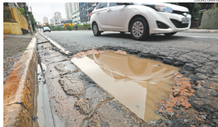
Obstáculo - Motoristas reclamam de cratera em uma das pistas da via

Em nota, o Saae informou que “a ocorrência de chuvas após uma intervenção na rede coletora de esgoto atrasou a realização da recomposição do pavimento com a colocação da capa asfáltica; esse serviço será executado nesta quinta-feira (ontem), desde que não chova”. Em caso de problemas de água e esgoto o cidadão pode pedir o reparo pelo telefone 0800-101042, que funciona 24 horas.