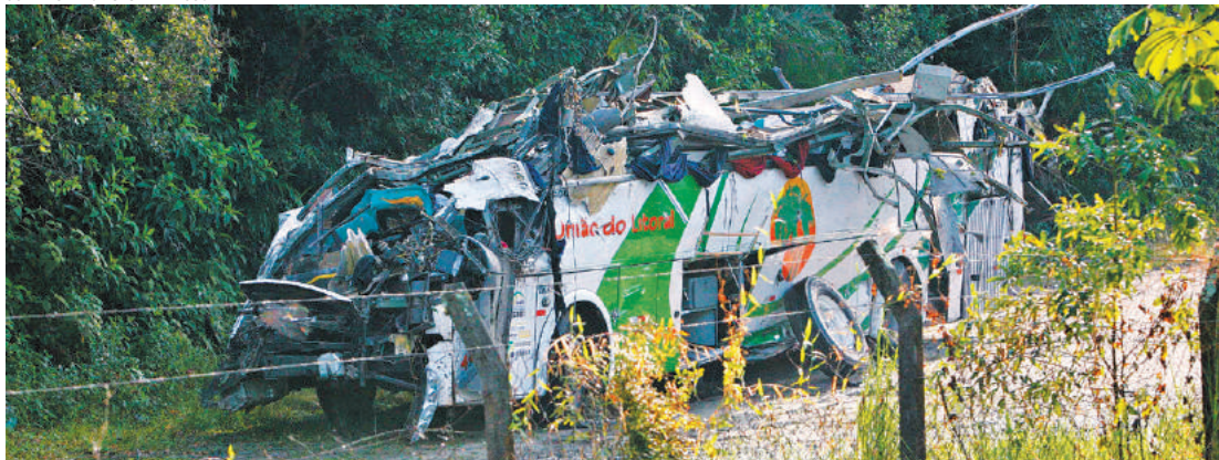
Destruído - Ônibus fretado ficou irreconhecível depois de capotamento em rodovia; 18 morreram no acidente