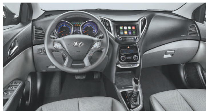
Luxo e requinte - Interior tem um acabamento muito esmerado