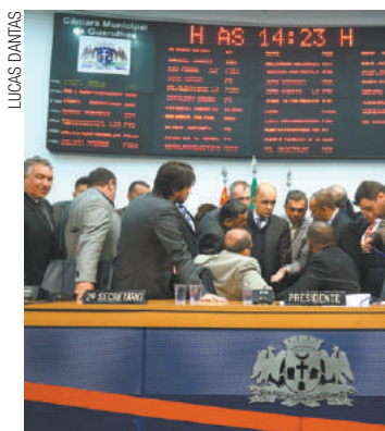
Debate - Vereadores discutem projetos que devem ser votados