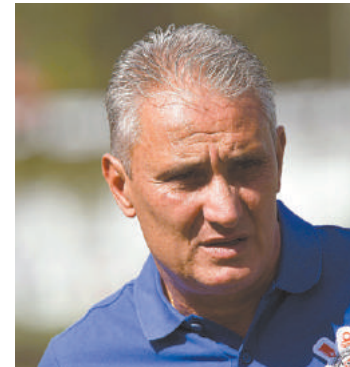
Suspense - Treinador e entidade adiam decisão sobre comando