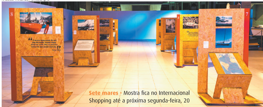
Sete mares - Mostra fica no Internacional Shopping até a próxima segunda-feira, 20