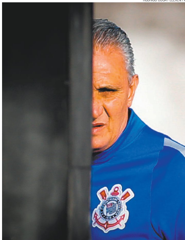
De saída - Tite atravessa o portão do CT na despedida do Corinthians

O agora ex-técnico do Corinthians aceitou o convite após ter sido assediado várias vezes no último ano, enquanto Dunga ainda estava empregado. Era um dos motivos pelos quais Tite não havia aceitado antes. No último contato, em abril deste ano, o técnico disse que não gostaria de deixar o Corinthians durante a disputa da Copa Libertadores.