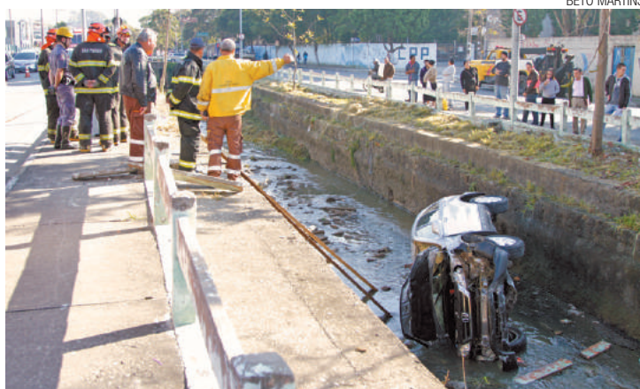
Susto - Bombeiros e agentes de trânsito observam o carro no córrego

De acordo com advogados que trabalham com Thais e estavam no local, ela também é advogada num escritório na