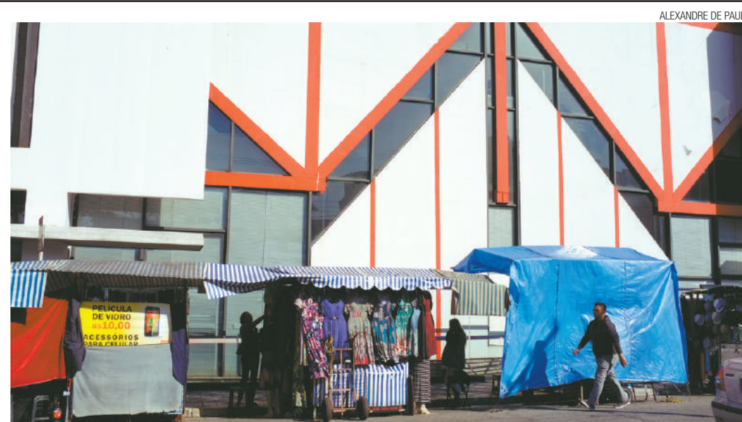
Cotidiano - Bancas de vendedores ambulantes contrastam, em harmonia, com linhas e formas arquitetônicas