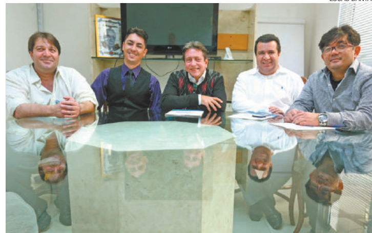
Visita - Secretário de Desenvolvimento Econômico (ao centro) esteve na FM