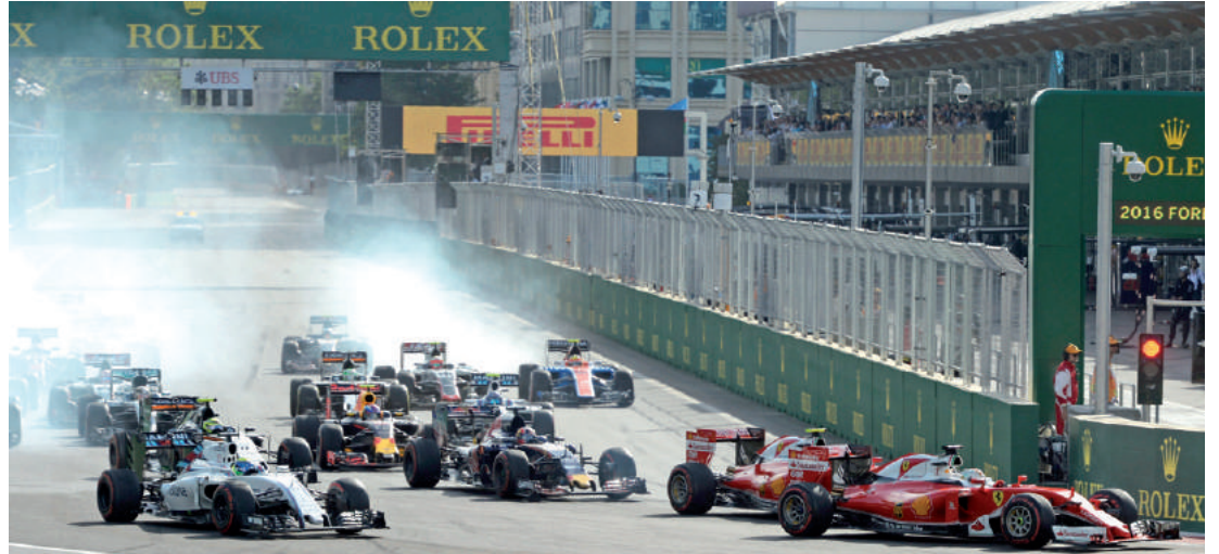
Prudência - Estreia de Baku (Azerbaijão) no circuito da Fórmula 1 teve muita cautela e raras ultrapassagens

não foi ameaçado. O protagonista da prova foi Sergio Pérez, que já brilhara no treino classificatório. O mexicano obteve o segundo tempo, mas precisou largar em 7.º porque fora punido no terceiro treino livre. Durante a prova, galgou posições até passar o finlandês Kimi Raikkonen, da Ferrari, na última volta para terminar em terceiro lugar.