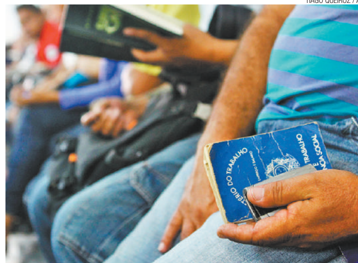
Vagas - Agência Pública Municipal de Emprego faz cadastro gratuito

Falta de mão de obra qualificada dificulta contratação