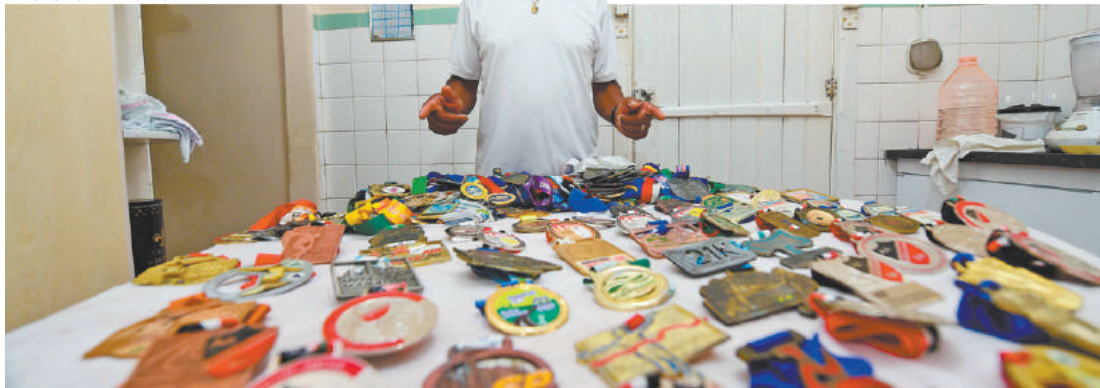
Orgulho - Cocada, apelido carinhoso que ganhou de um ex-chefe, exhibe medalhas das provas que participou