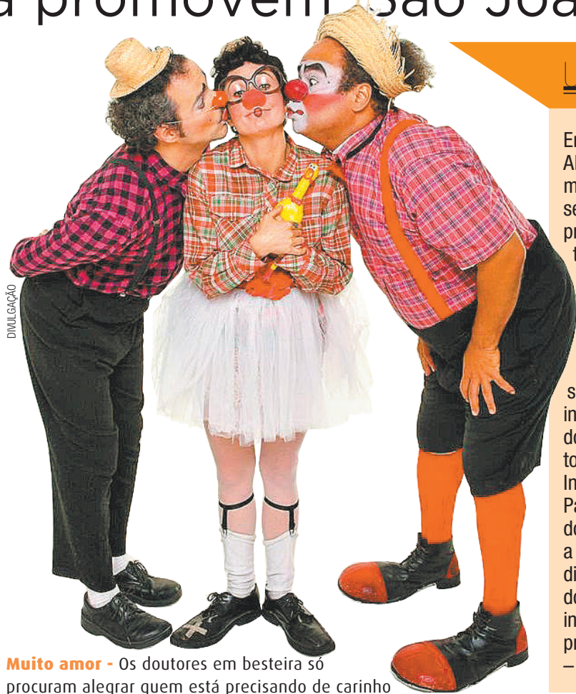
Muito amor - Os doutores em besteira só procuram alegrar quem está precisando de carinho

Avenida Professor Lineu Prestes, 2565, Butantã.