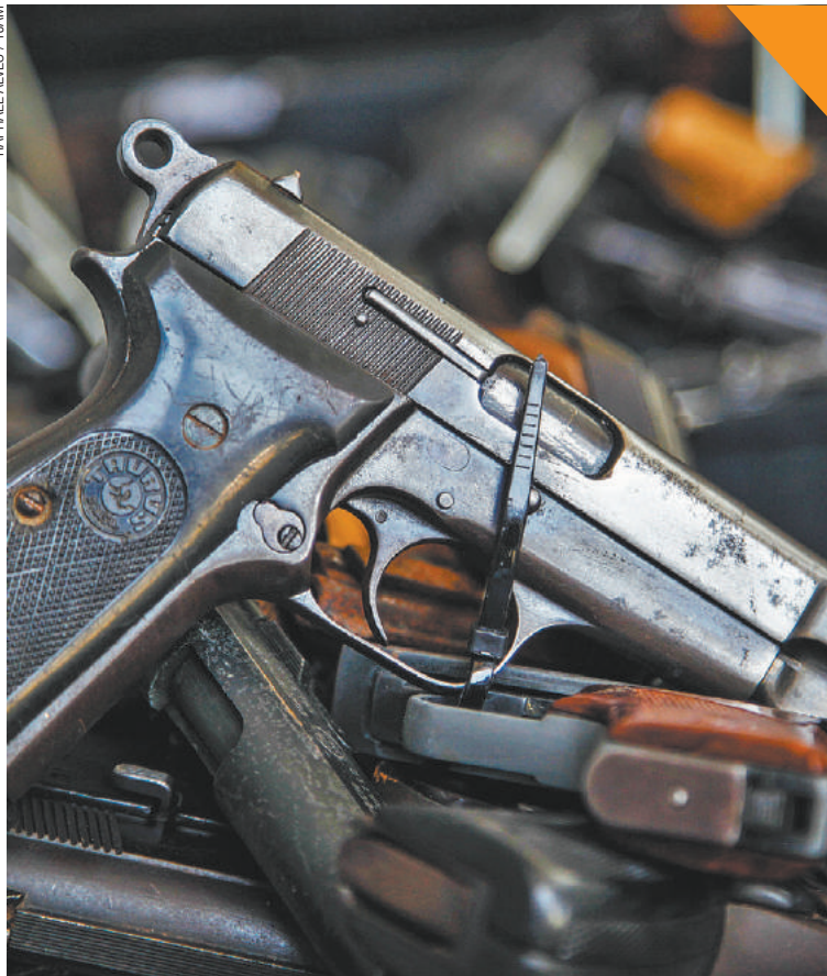
Porte - Deputado propõe votação de PL que facilita a compra de armas