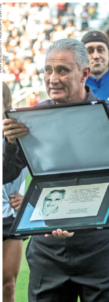
Gratidão - Tite recebeu placa em homenagem às conquistas no Timão