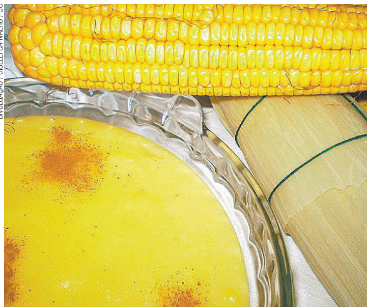
Delícias do milho - Pamonha e curau degustados sem nenhuma culpa

• Tapioca: rica em carboidratos e com alto teor energético, a tapioca é produzida a partir da mandioca. Po-