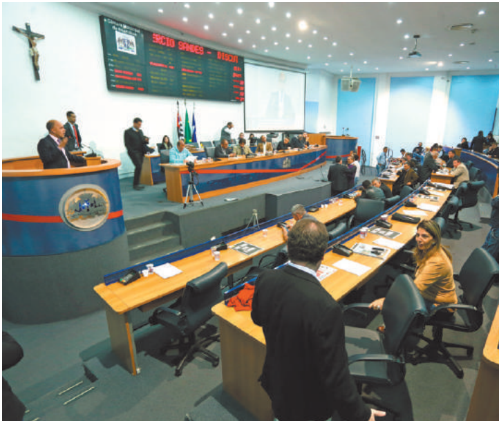
Base - Situação acredita que contas do governo de 2012 serão aprovadas