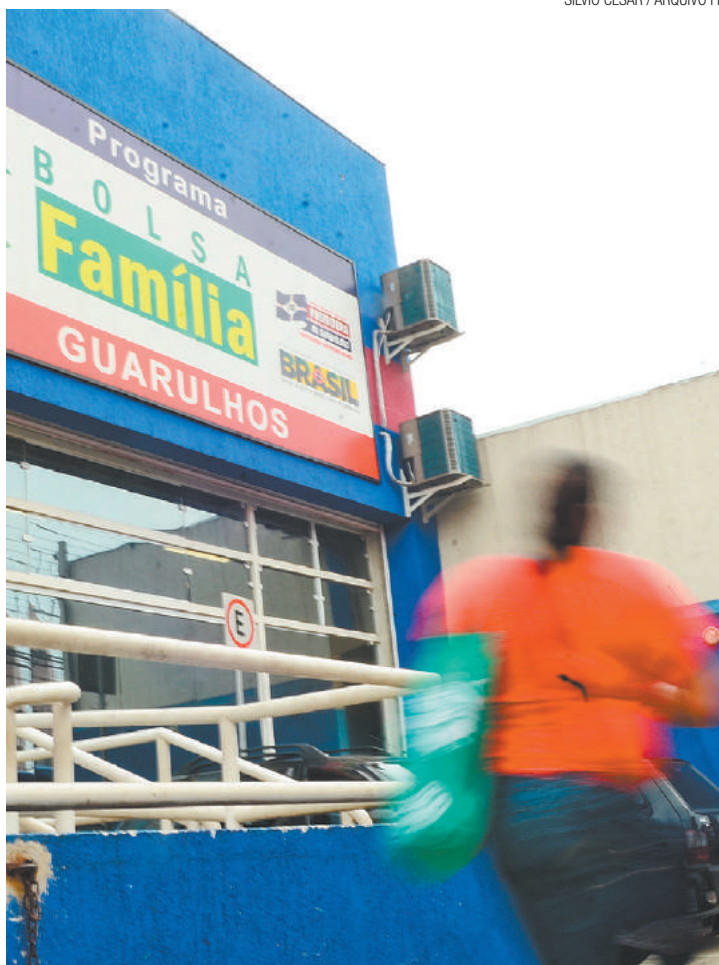
Auxílio - Mais de 5 mil famílias que teriam direito não são atendidas

Para resolver este problema, a Secretaria realiza ações como o Busca Ativa, na qual barracas são instaladas em diferentes regiões da cidade para cadastrar pessoas que possam receber a ajuda financeira.