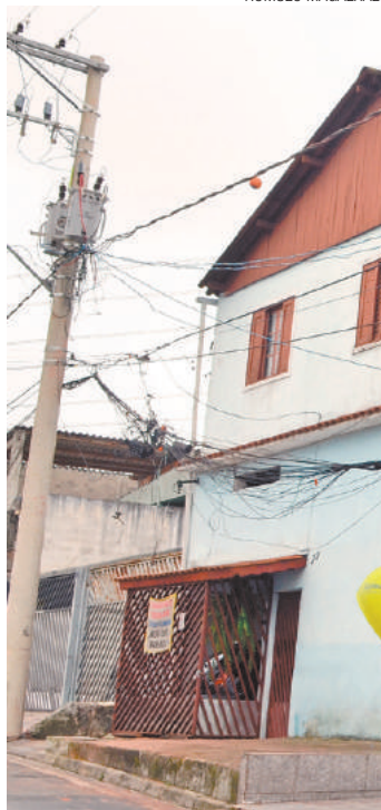
Perigo - Emaranhado de fios ficou pendurado a poucos metros

A EDP informou que as empresas de telecomunicações, que utilizam também os postes, foram comunicadas sobre a intervenção e sobre a necessidade da posterior manutenção dos fios.