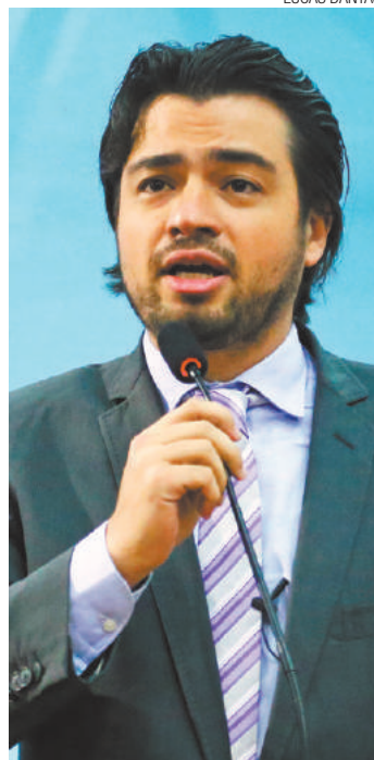
Até aprovar - PL do vereador já foi apresentada outras duas vezes

Caso o projeto de lei seja aprovado, nenhum cargo comissionado poderá ser ocupado por aquele que tiver condenação transitada em julgado ou proferida por órgão judicial colegiado.