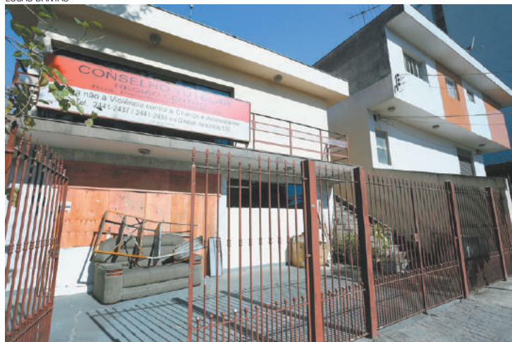
Interditado - Andar térreo do prédio no Centro ficou bem avariado