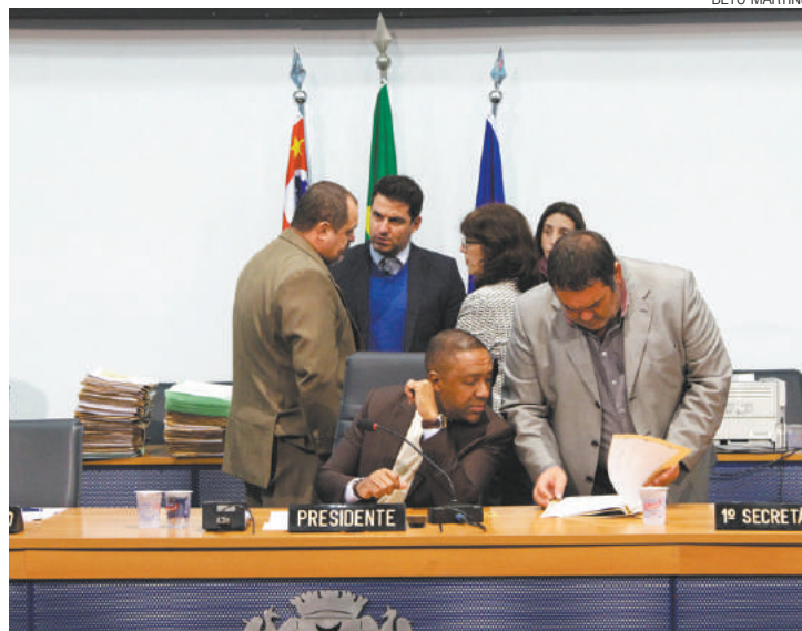
Sessão - Vereadores deliberam três projetos por conta de prazo regimental

Base precisa ter apoio de 23 votos para aprovação