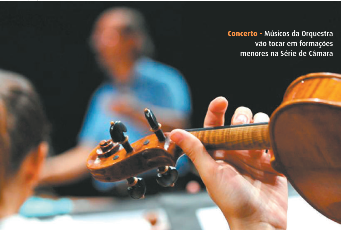
Concerto - Músicos da Orquestra vão tocar em formações menores na Série de Câmara