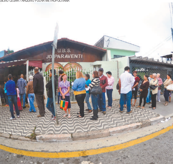
Crise - Saúde pública é um dos maiores desafios para a gestão pública