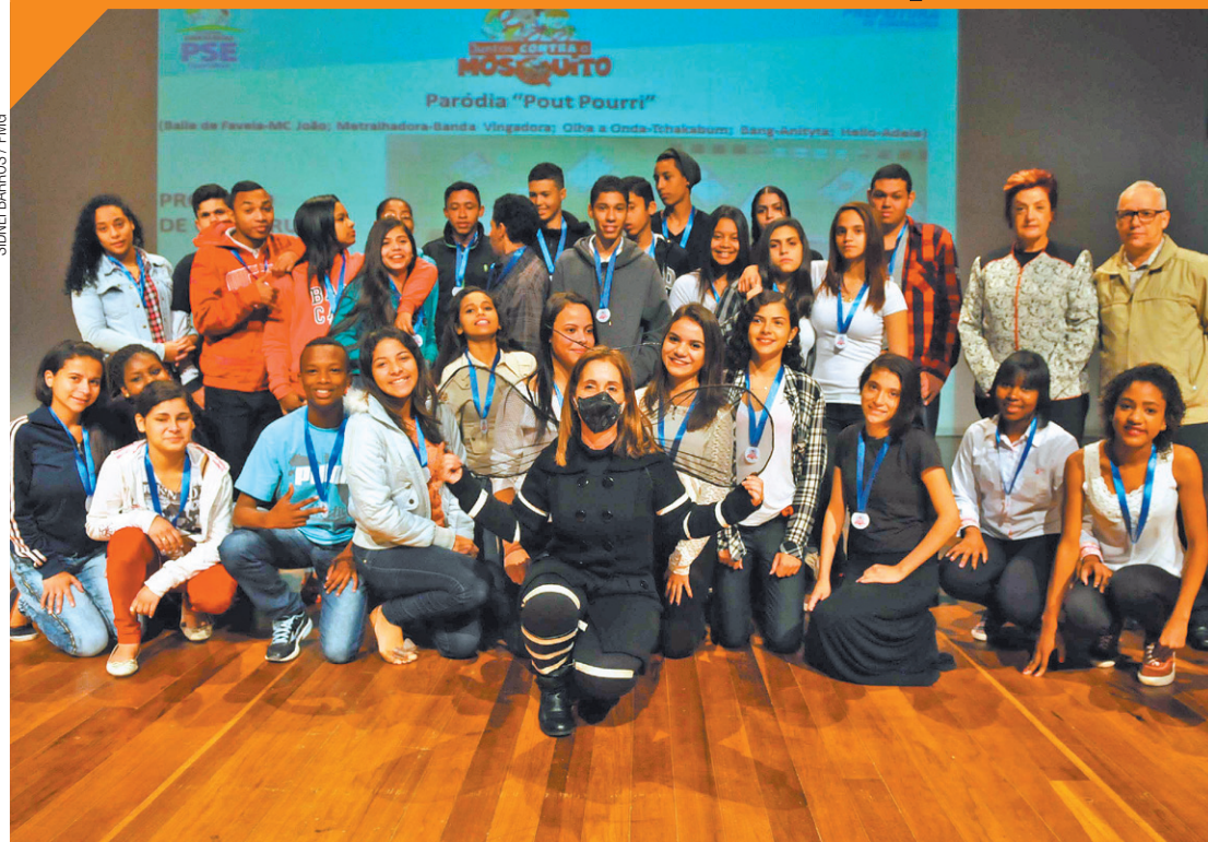
SIDNEI BARRIOS / FIMG

Desperdício - Tricolor não consegue superar o Sport e segue fora do G4