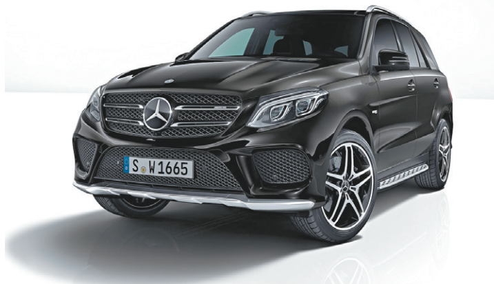
Performance AMG - Aceleração de 0 a 100 km/h em 5,7 segundos

Um display de partida de alta qualidade acolhe o condutor: a tela central do painel mostra o letreiro AMG no estilo dos emblemas dos para-lamas dianteiros, exclusivos dos modelos da marca. Os pedais de aço inoxidável escovados com insertos de borracha agregam esportividade ao veículo.