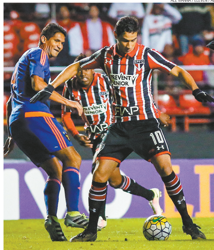
Empate magro - Ganso e companheiros não conseguiram superar o Sport

ÁRBITRO - Rafael Traci (PR). CARTÕES AMARELOS - Edmilson, Samuel Xavier (Sport). PÚBLICO - 11.145 pessoas. RENDA - R$ 321.680,00. LOCAL - Estádio do Morumbi, em São Paulo.