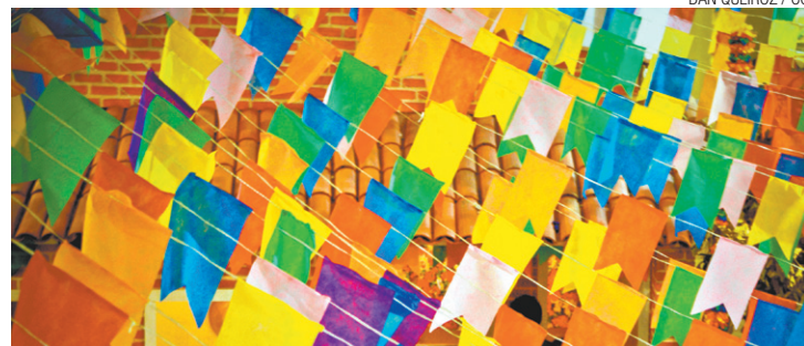
DAN QUEIROZ / CC

A Oncoamigo está há 11 anos em Guarulhos e presta serviços socioassistenciais gratuitos a crianças e adultos portadores de câncer da cidade e da Capital. São diversos programas realiza-