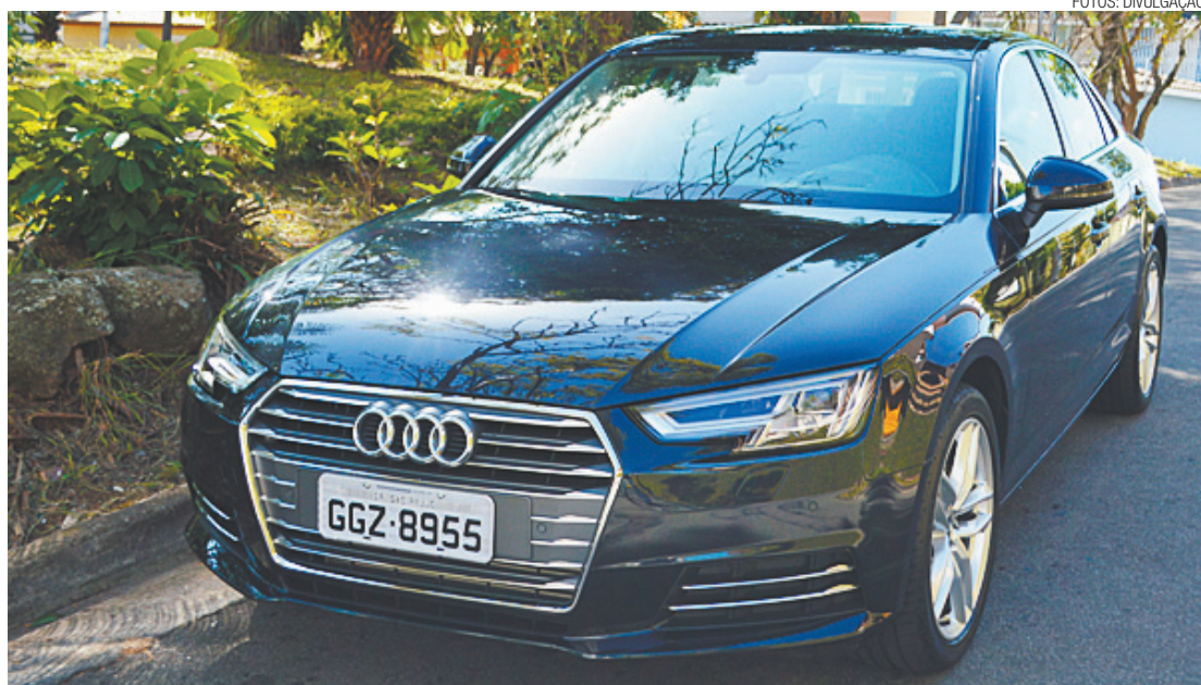
Robusto - Novo A4 conquista o consumidor já do lado de fora, com um desenho que transmite elegância

Há que se destacar também o eficiente câmbio S tronic de sete velocidades. Como dispõe de dupla embreagem, as trocas de marchas são quase instantâneas. Para maior economia de combustível, a Audi informa que o câmbio agora oferece uma função roda-livre. O controle seletivo de torque para cada uma das rodas suplementa o trabalho da tração dianteira.