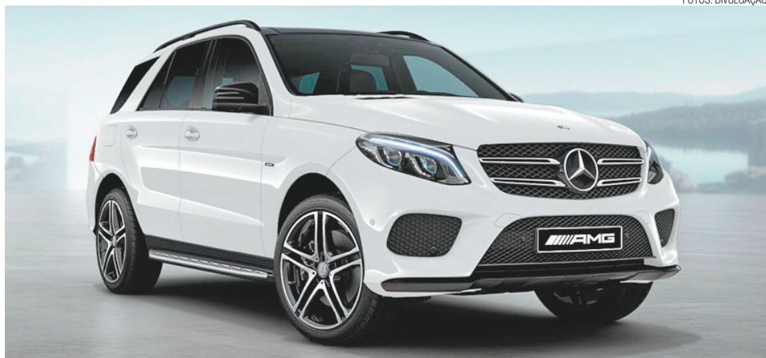
Limitado - Serão comercializadas apenas 20 unidades do novo GLE 450 AMG 4MATIC Black Edition no Brasil

O GLE 450 AMG 4MATIC Black Edition já está disponível em toda a rede de concessionários da Mercedes-Benz, com preço sugerido de R$ 475.900.