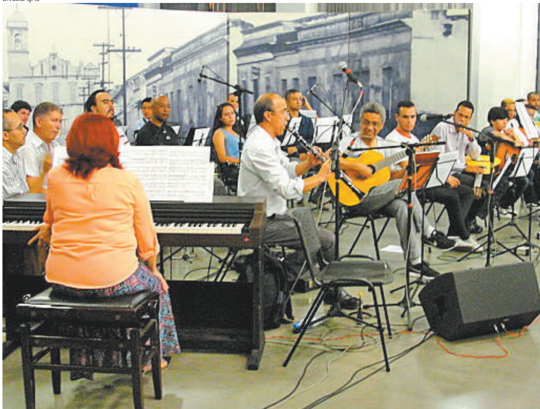
Música - Repertório está recheado de compositores que marcam o gênero, como Pixinguinha e Jacob do Bandolim