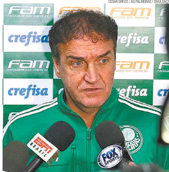
Alerta - Cuca entende que é necessário reagir e evitar novos tropeços

A próxima partida do Palmeiras fora de casa será em 4 de julho, contra o Sport, pela 13ª rodada do Brasileirão.