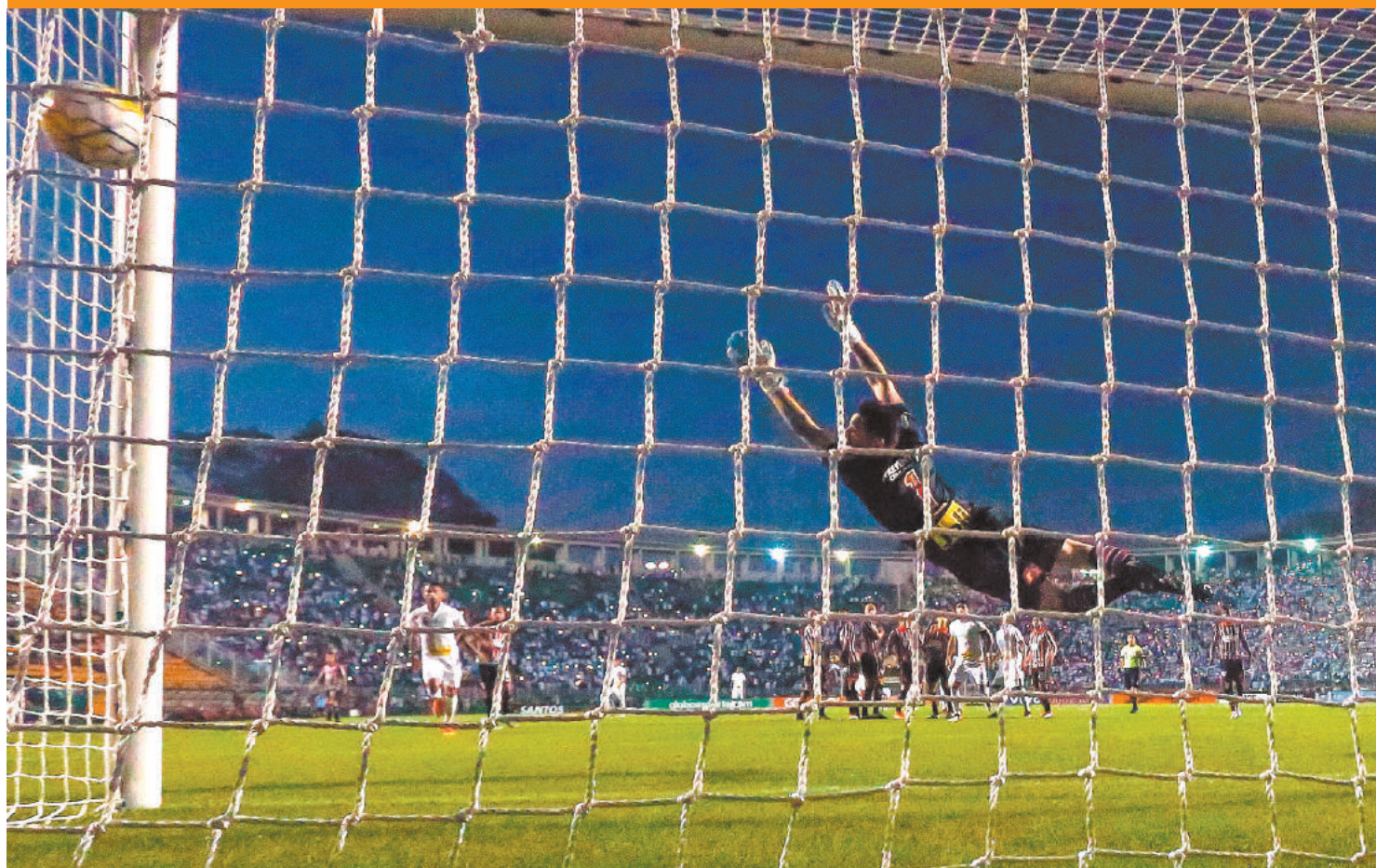
MARCELO ZAMBRANA / AFB / AFE