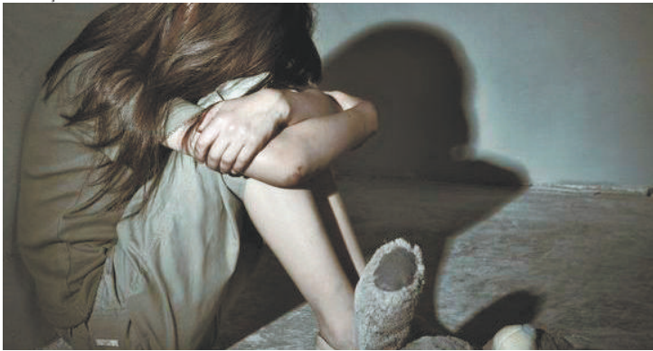
Sofrimento - Trauma do estupro perdura por toda vida da criança