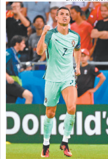
Maior de todos - CR7 iguala Platini como artilheiro da Euro