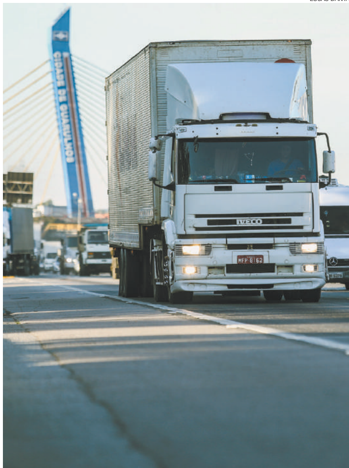
Trânsito - Caminhão com os faróis acesos trafegando ontem na Via Dutra

Antes, uma resolução de 1998 do Conselho Nacional de Trânsito (Contran) apenas recomendava o uso do farol baixo nas rodovias durante o dia. O uso do farol baixo à luz do dia já é exigido para ônibus, ao circularem em vias próprias, e motocicletas.