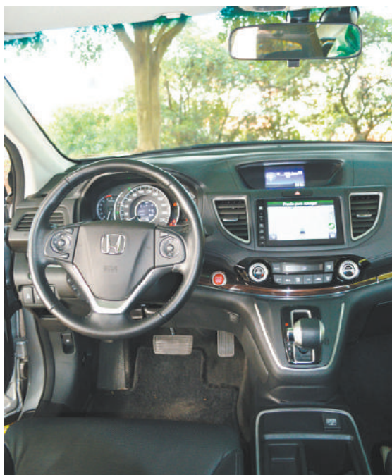
Painel - Concilia bem-estar e itens com mais informações

Quem conhece os carros da Honda sabe que o item conforto sempre foi levado em consideração. Porém, a marca – assim como outros japoneses – não primava tanto em equipamentos tecnológicos em seus modelos, optando pela simplicidade nas soluções. Já o novo CR-V consegue conciliar o bem-estar a bordo com itens que garantem mais comunicação e acesso a informações.