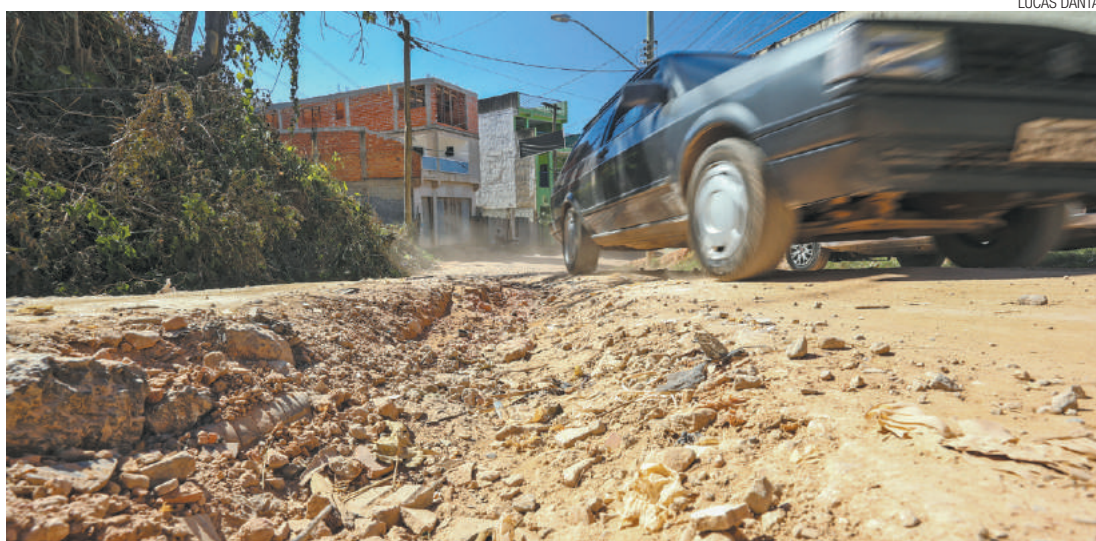
Cascalhos - Pedras jogadas na rua pelos próprios moradores para amenizar não ficam por muito tempo no local