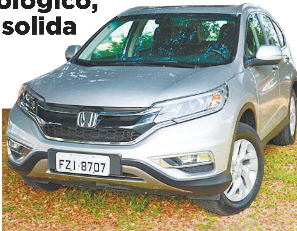
"Real Time" - Modelo tem tração 4x4 que corrige a falta de aderência nas rodas em terrenos acidentados