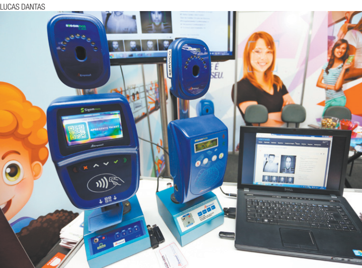
Fiscal - Biometria facial reconhece se usuário é o detentor do bilhete