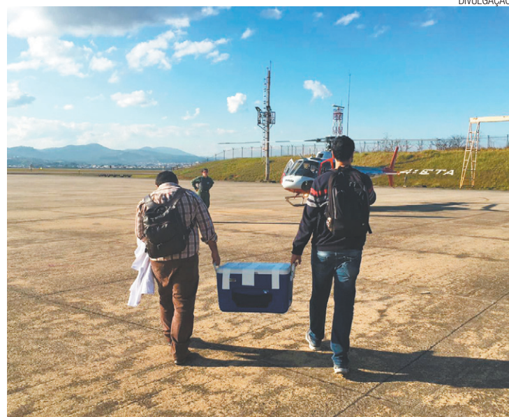
Ação - Equipe fica de sobreaviso pronta para atender a qualquer chamado

No dia 1º deste mês, um coração, um fígado e um par de rins foram levados de Catanduva ao INCOR de São Paulo e ao Hospital dos Bandeirantes.