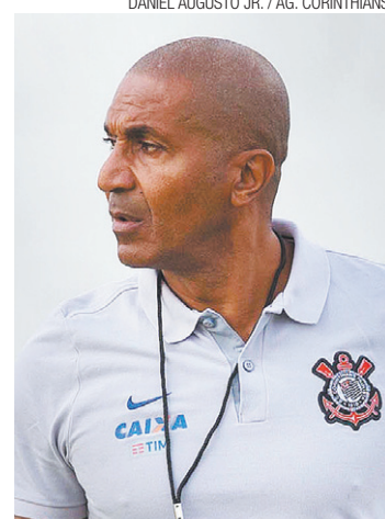
Clássico - Treinador evitou falar sobre favoritismo contra o Tricolor