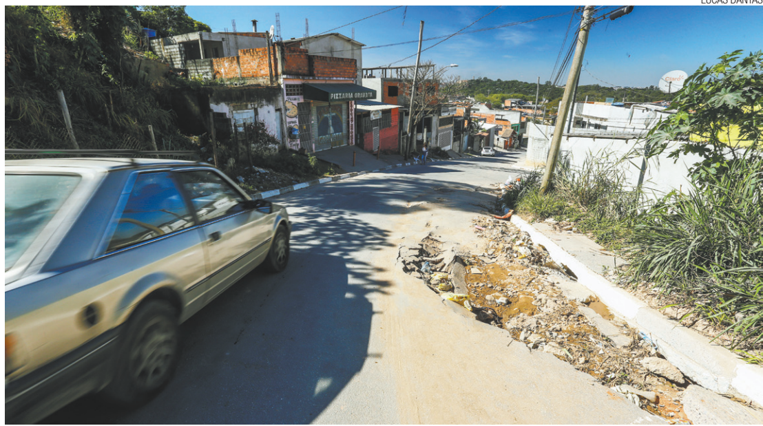
Risco - Na Rua Ajax existe um grande buraco que já incomoda os motoristas há pelo menos dois meses