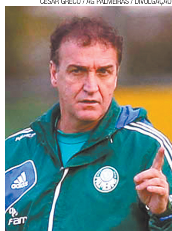
Recuperação - Técnico aguardará até o último minuto para escalação

Desde quinta-feira, a dupla só treinou na academia. O treinador afirmou, no entanto, que eles são jogadores que não necessitam de treinamentos diários, pois apresentam bom condicionamento. No único treino aberto à imprensa nos