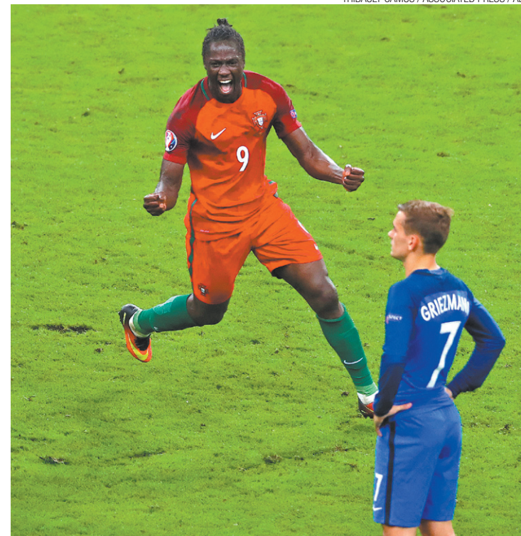
Garra - Éder, autor do gol do título, comemora diante de Griezmann

GOL - Éder, aos três minutos do segundo tempo da prorrogação. CARTÕES AMARELOS - Rui Patrício, Cédric, Raphaël Guerreiro, João Mário e William Carvalho (Portugal); Umtiti, Matuidi, Koscielny e Pogba (França). ÁRBITRO - Mark Clattenburg (Fifa/Inglaterra). REND A PÚBLICO - Não disponíveis. LOCAL - Stade de France, em Saint-Denis (França).