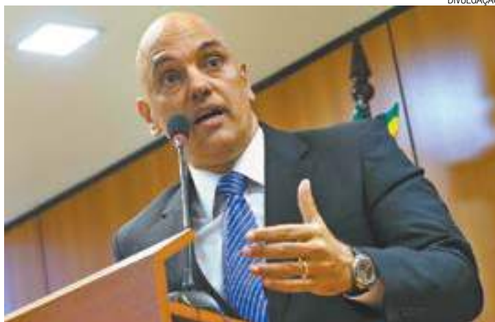
Anúncio - Alexandre de Moraes, Ministro da Justiça, em coletiva ontem

Ambos os suspeitos foram enquadrados em dois artigos da lei antiterrorismo, que considera crime o indivíduo integrar facção terrorista e iniciar atos preparatórios para realização de atentados.