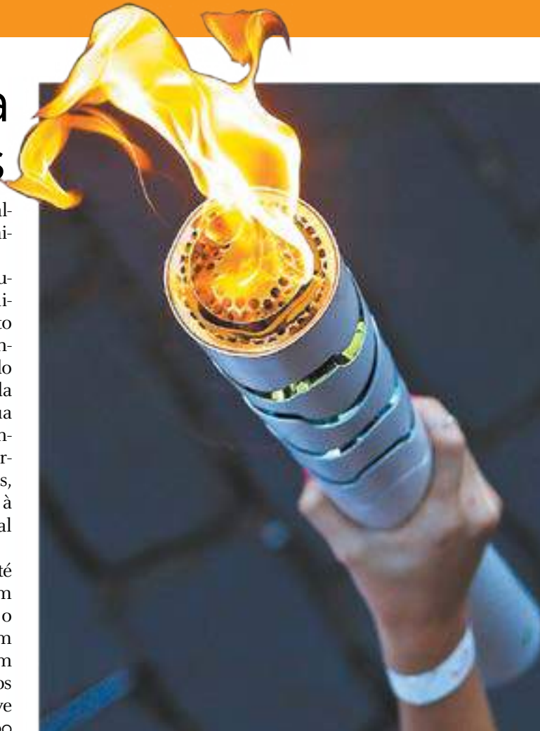
Chama - Tocha vai percorrer a região central da cidade, conduzida por 52 pessoas em mais de 10 quilômetros

Bosque Maia vai concentrar festejos amanhã