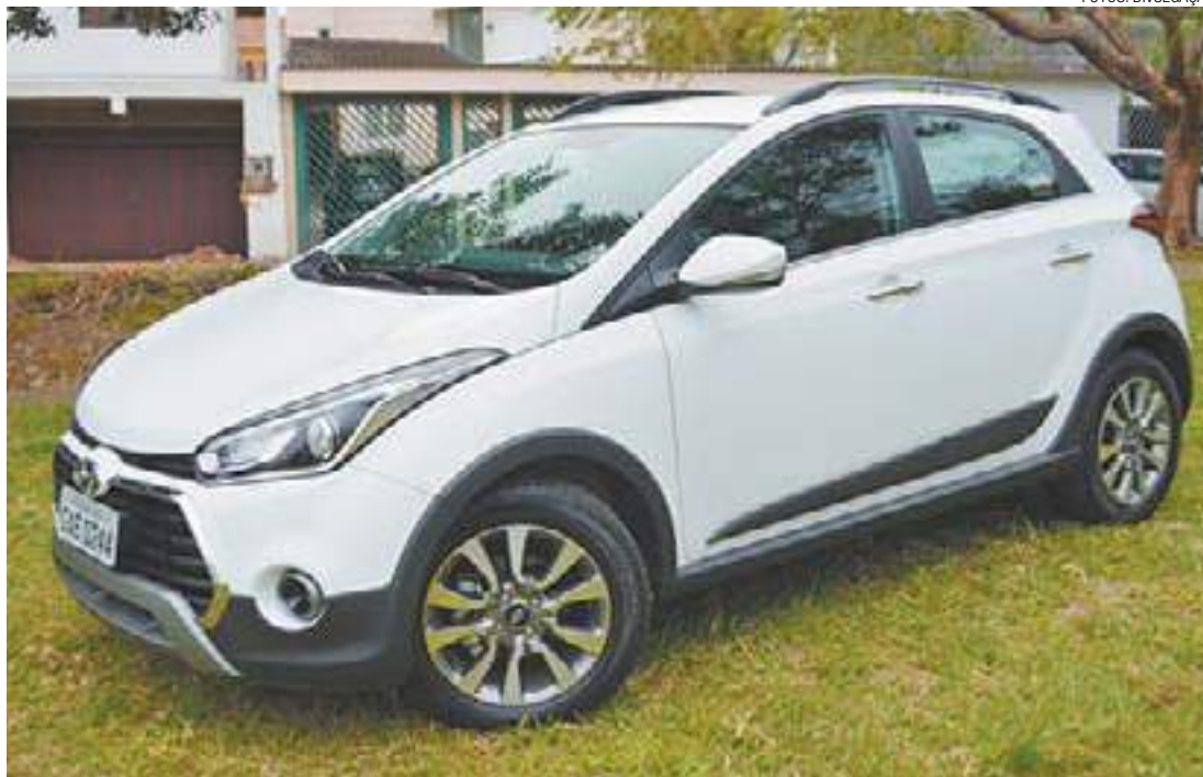
Arrojado - Aparência aventureira com proteções robustas da carroceria e barras de teto com acabamento preto

Motor Gamma 1.6 de 128 cv e 16,5 kgfm conta com o câmbio automático