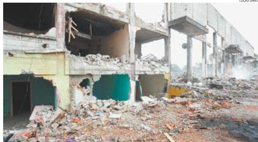
Hatsuta - Fábrica de patinetes motorizados abandonada e favela por 20 anos, local abrigará um estacionamento