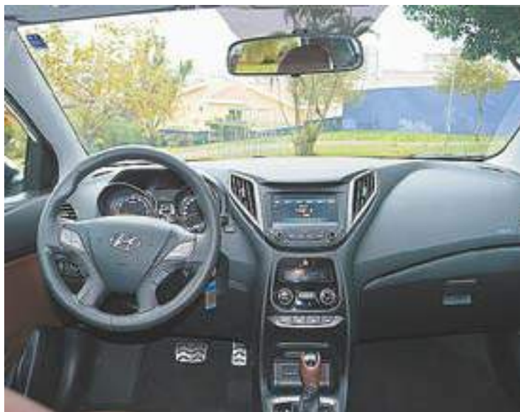
Painel - Versão topo de linha tem ar-condicionado automático digital com acabamento em preto brilhante