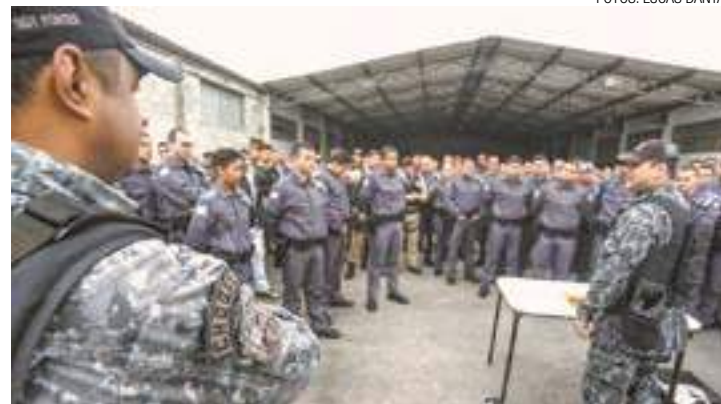
Aula - Cerca de 200 PMs ouvem especialistas do esquadrão especializado

A primeira explosão foi realizada dentro de uma lata de tinta de 20 litros. Foi colocado dentro do objeto somente 0,8 grama de explosivo que, após detonado, arrancou a tampa da lata e provocou centenas de micro perfurações nela.