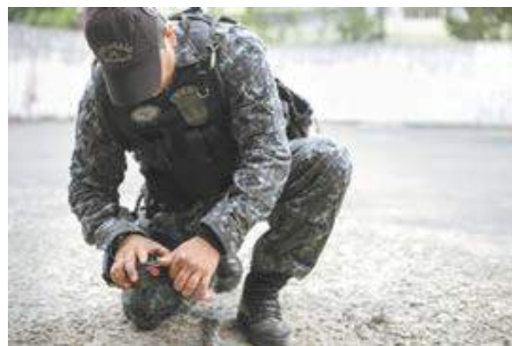
Prudência - Foram dadas orientações de como proceder com artefatos