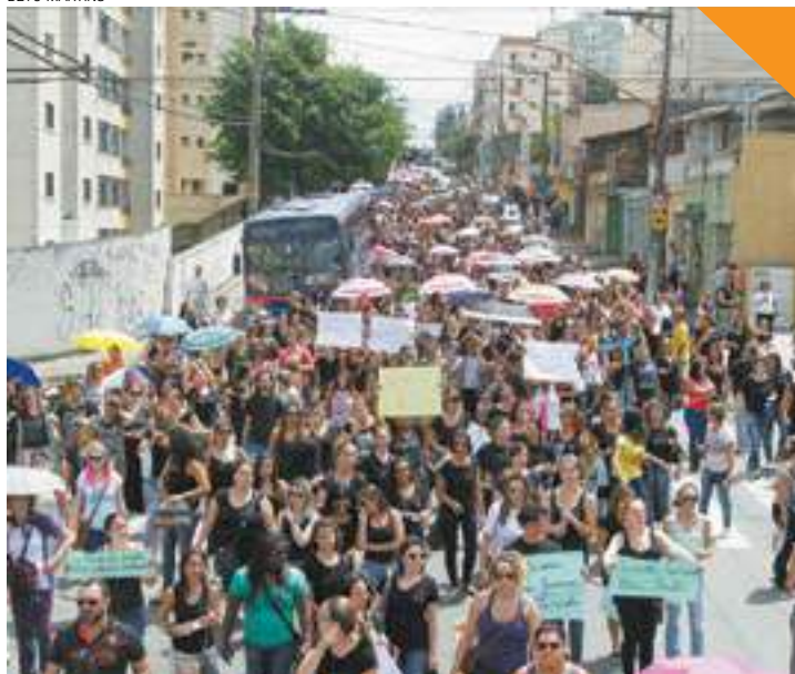
Retorno - Greve começa exatamente no período de volta para as aulas