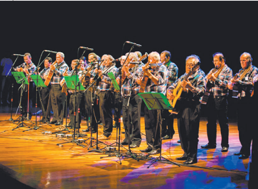
Lendária - Orquestra de Violeiros Coração da Viola, formada na década de 1970, retomou atividades em 2013