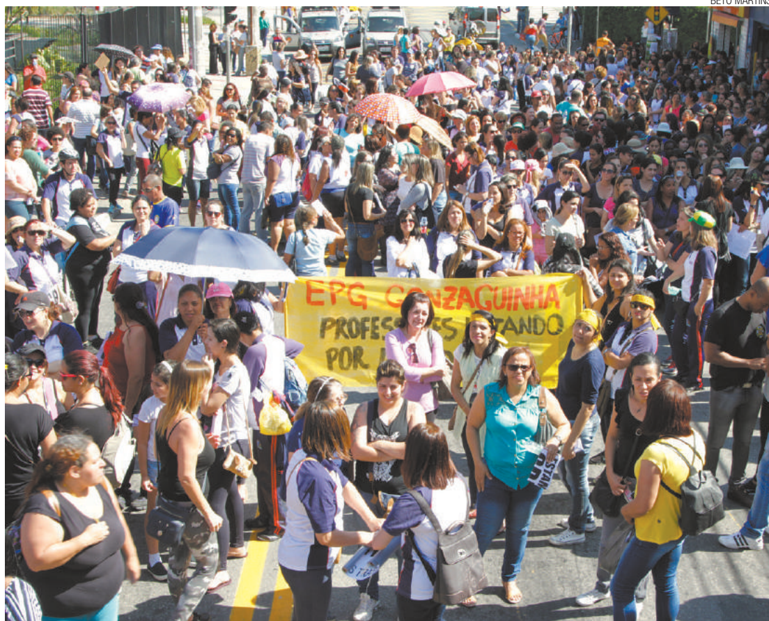
Mobilização - Professores pararam a Região Central para cobrar do governo o acordo firmado com a Justiça

Na manhã de ontem, os servidores se reuniram na Praça Getúlio Vargas, no Centro, e caminharam até o Adamastor. A passeata piorou o trânsito em toda a região central. Das 146 escolas municipais, o sindicato calcula que pelo menos 126 já se juntaram ao movimento. As perdas salariais da categoria chegam a atingir R$ 6 mil.