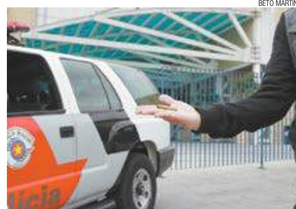
Ousadia - Quadrilha explodiu ao menos cinco terminais bancários; a quantia levada não foi informada