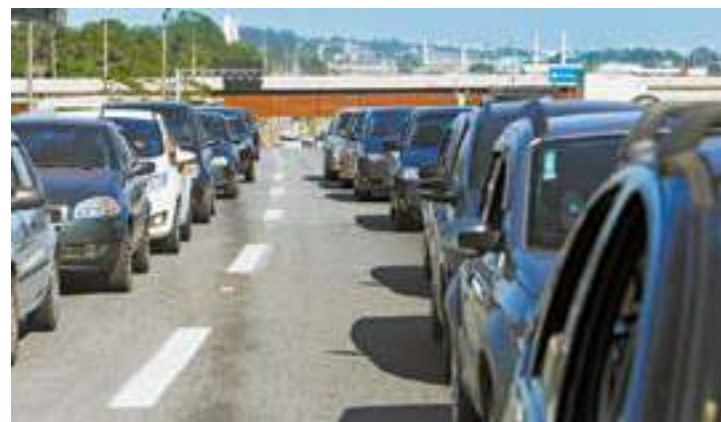
Aumento - Motoristas já começaram a pagar novo preço de pedágio