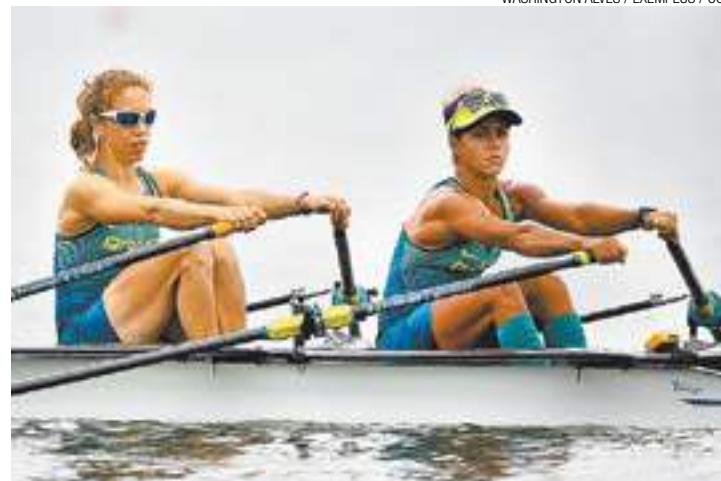
Força - Remadoras terão a torcida dos filhos durante a competição