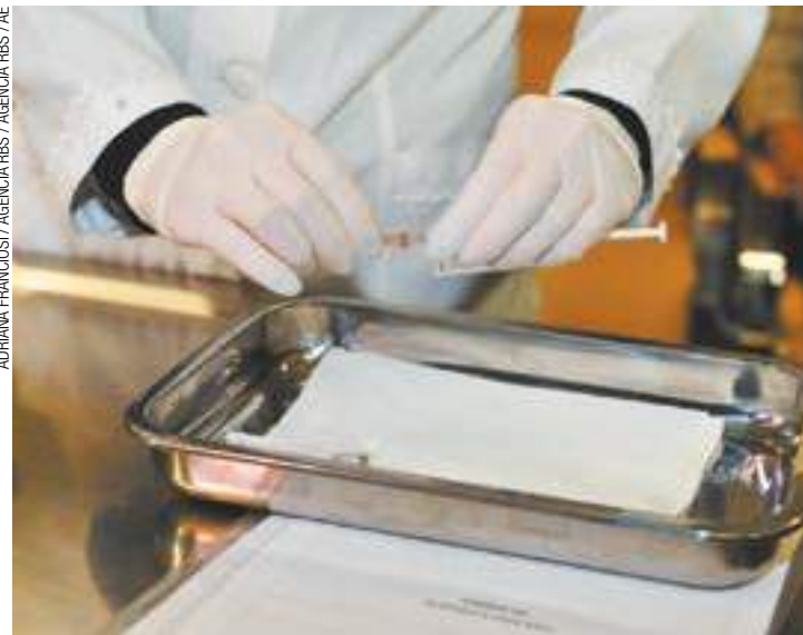
Preparação - Vacina gratuita está sendo testada no Rio Grande do Sul

O valor final do produto representa mais do que o dobro do definido pelo Comitê Técnico Executivo da Câmara