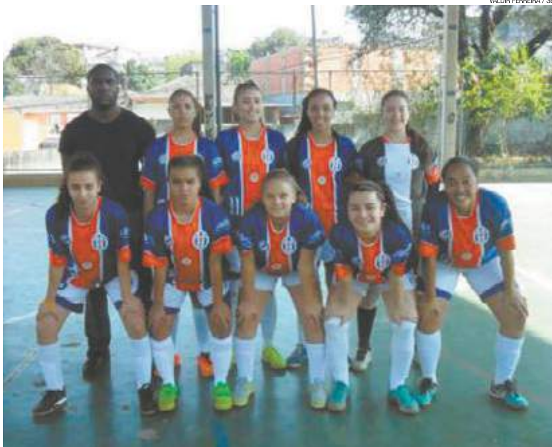
Futsal - Equipe do Clube Atlético Guarulhense estreou na Copa SEA vencendo o Sem Limite, de virada, por 4 a 3

O C.A.Guarulhense volta à quadra no próximo domingo, 7, às 11h50, contra o Ascas Ponte Alta. A partida será realizada na mesma quadra do último domingo, que fica na Rua Belém, 259, no Jardim Novo Portugal (Região São João), em Guarulhos.