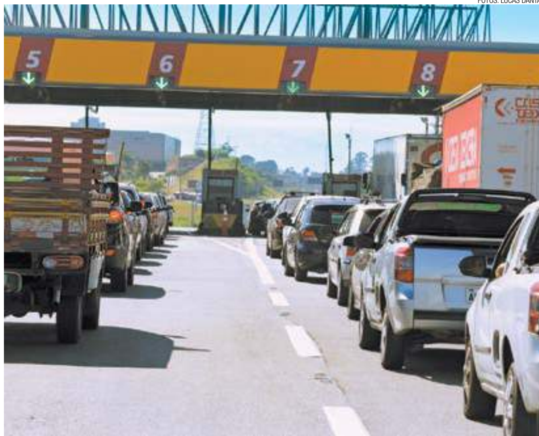
Imposto - Valor recebido pelo município equivale a 5% do total arrecadado nos pedágios da rodovia

Os recursos são destinados aos municípios para melhorias com obras e serviços e financiamento de projetos sociais.