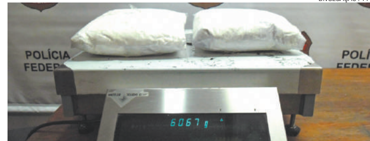
Drogas - Entre a noite de quinta e a madrugada de ontem houve 3 prisões

A primeira prisão ocorreu no final da noite de quinta no check-in de voo com destino a Gana. Uma mulher de 33 anos, natural daquele país, foi selecionada para entrevista. A passageira usava roupas extremamente largas, fato que chamou atenção dos policiais. Após a realização da entrevista, as bagagens foram vistoriadas e, durante a