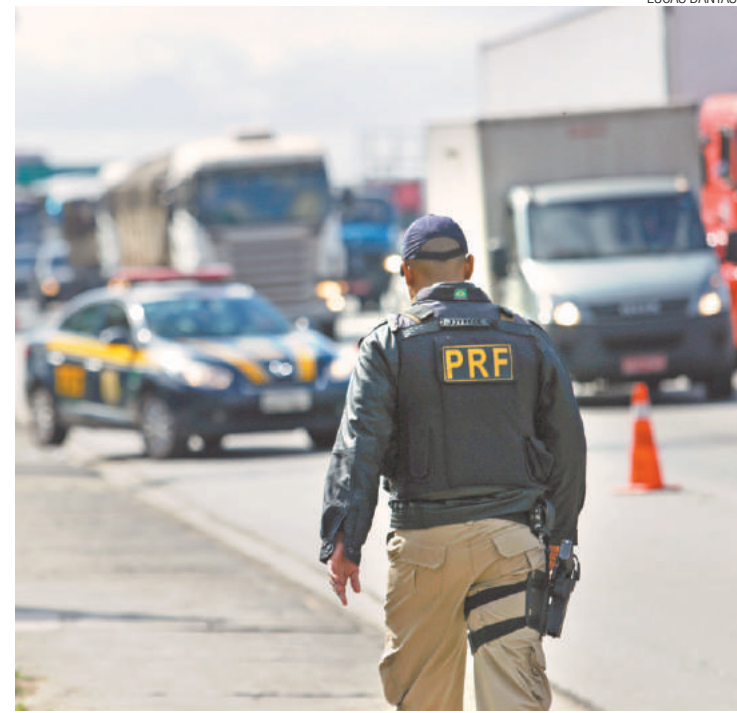
Trânsito - Agente da PRF no km 220 da Via Dutra, sentido São Paulo

A CCR NovaDutra, administradora da rodovia, informou que houve interdição das faixas da esquerda e central da Dutra. Foram registrados 4,5 quilômetros de lentidão. O tráfego foi normalizado às 8h39.