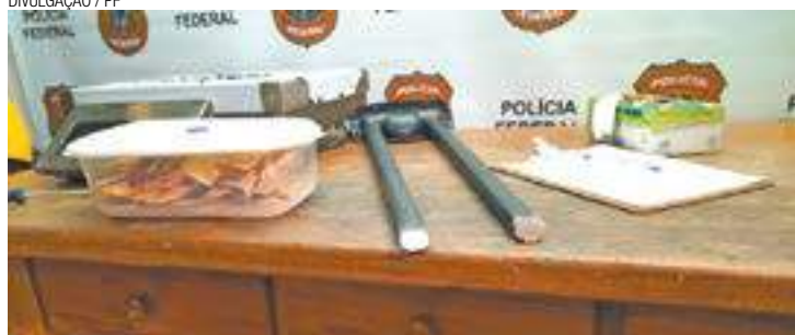
Droga - Nas hastes das três malas havia mais de cinco quilos de cocaína