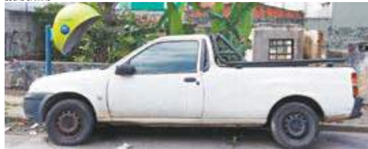
Absurdo - Moradora também reclama de carro abandonado há 6 meses