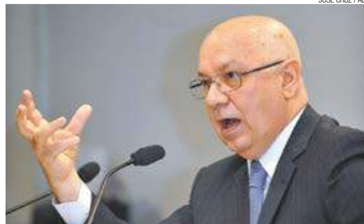
Decidido - Zavascki determinou que dinheiro não pode ser bloqueado

TJ-SP contrariou decisão do STF emitida em 2010