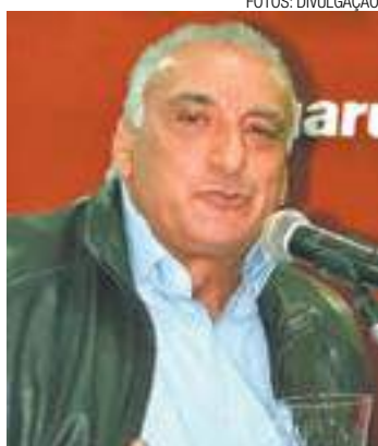
Empreendedor - Tucano é da área industrial há mais de 30 anos

“Estudei o assunto para mostrar aos empresários que este momento da luta de classes tem que ser muito bem pensado. Essa ideia de termos o empresariado constantemente em posição antagônica ao proletariado, aos trabalhadores, não pode subsistir”, disse Albertão.