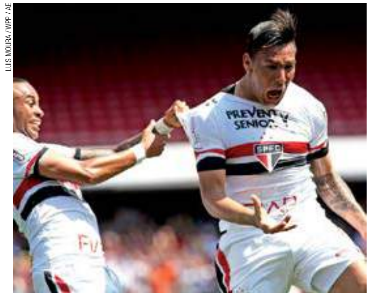
Xô zica - Chavez abriu o placar aos 30 minutos do primeiro tempo