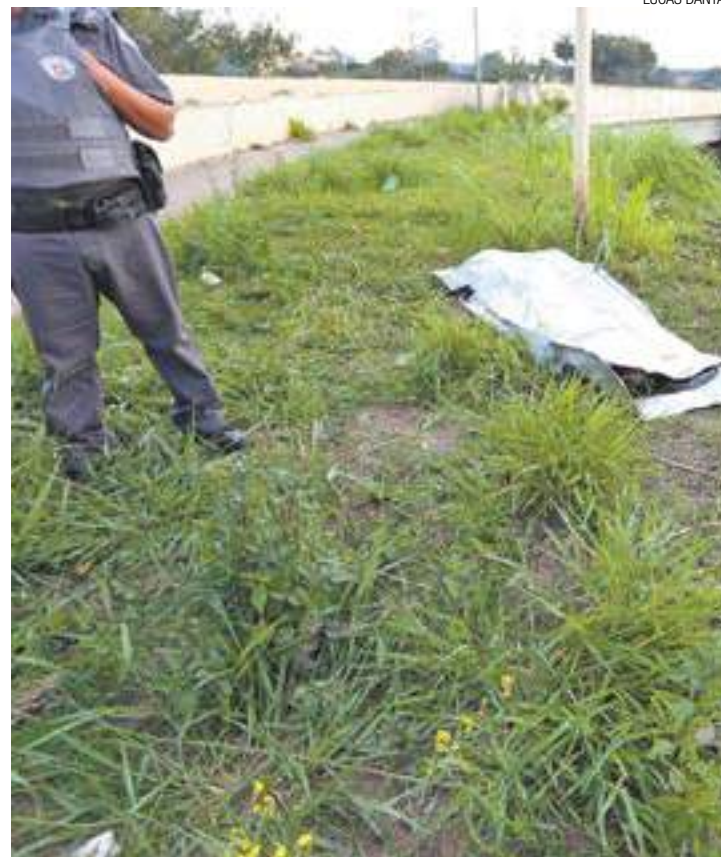
Rotina - Policial preserva local de homicídio às margens da Fernão Dias

Foram mortas em Guarulhos entre janeiro e julho