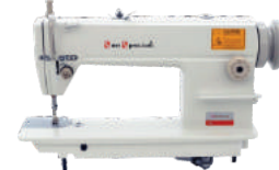
01 Retal Industrial Convencional (para cada loja)