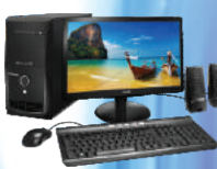
01 Computador (para cada loja)