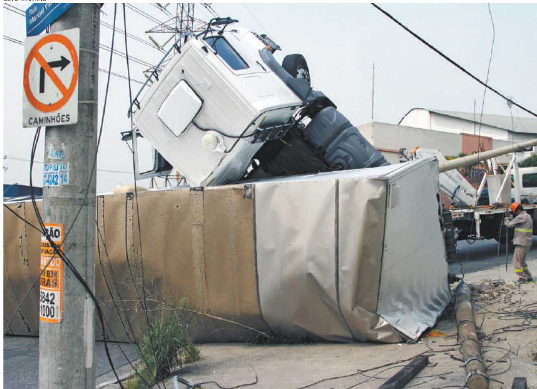
Susto - Motorista perdeu o controle do caminhão, derrubou um poste e uma luminária; ninguém saiu ferido