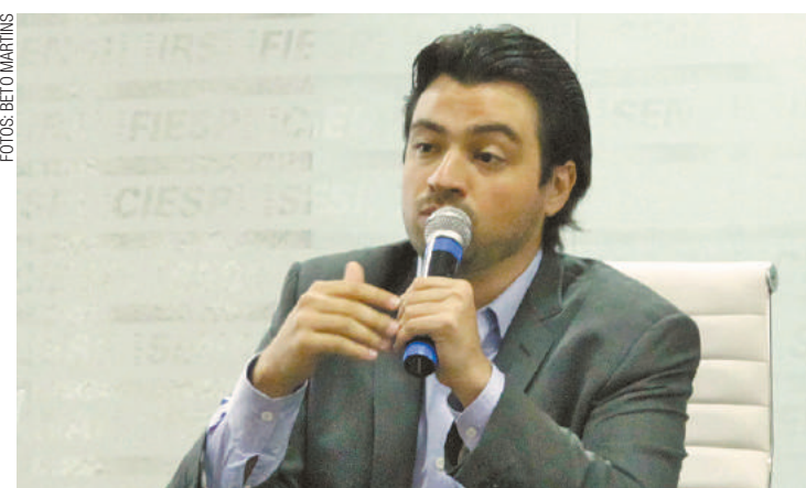
Guti - 'Muitos deixam de valorizar o crescimento trazido pelas indústrias'