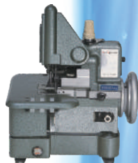
01 Overlock Semi Industrial (para cada loja)