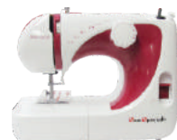
03 Máquinas de Costura Doméstica (para cada loja)