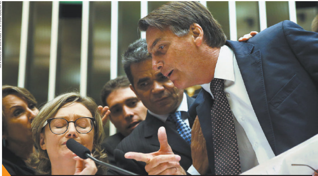
Briga feia - Bolsonaro inicia forte discussão com a deputada federal Maria do Rosário (PT-RS)