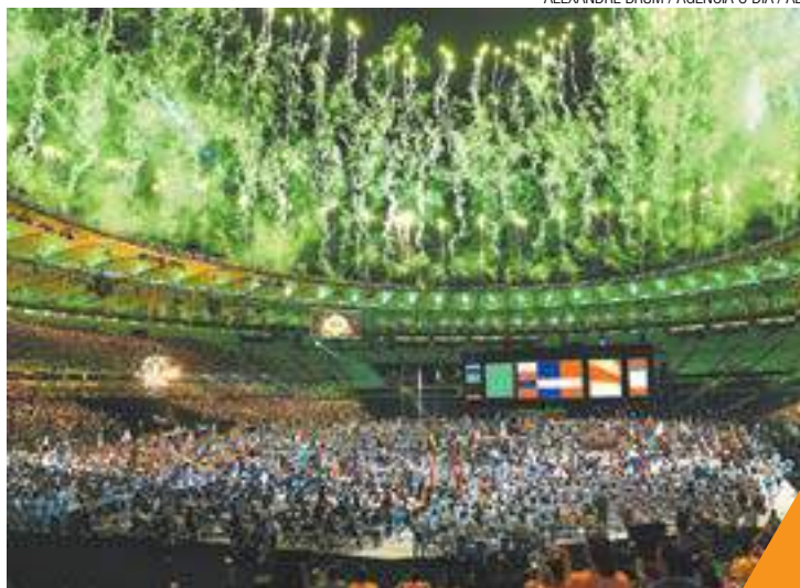
Emoção - Cerimônia de encerramento contou com criatividade

Como a Rússia foi punida e não pôde participar dos Jogos Paralímpicos do Rio, imaginava-se que sem este país, que é uma potência esportiva, a meta do Brasil ficaria mais fácil de ser alcançada.