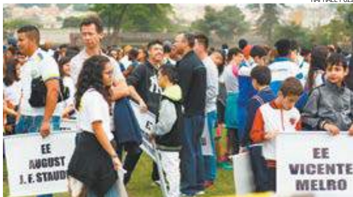
Descontração - Alunos das escolas de Guarulhos foram à Ponte Grande

O evento, que começou ontem, termina em 30 de setembro. As modalidades em disputa são atletismo, basquete, capoeira, damas, futebol, futsal, ginástica artística, ginás-