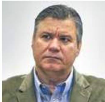
Néfi Tales - Filho de ex-prefeito já foi secretário de Obras e Transporte