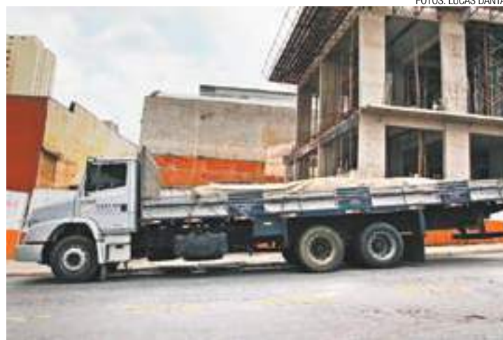
Crescente - Em janeiro deste ano foram registrados 25 casos e 52 em julho