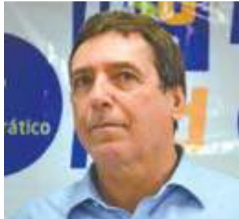
Martello - Ex-deputado federal e ex-presidente da Câmara Municipal