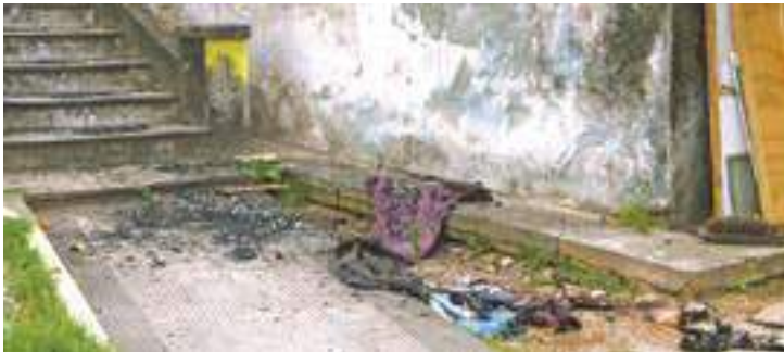
Irregular - Moradores de rua e usuários de drogas usam local como abrigo