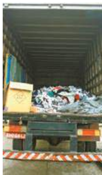
Queda - No ano passado, crimes do gênero registraram baixa de 40%