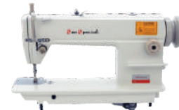
01 Reta Industrial Convencional (para cada loja)