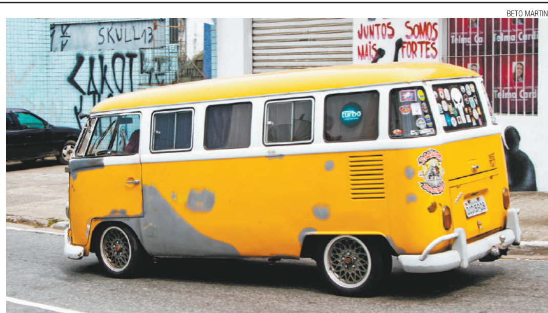
Utilitário - Perua Kombi, cheia de adesivos, rebaixada e com rodas incrementadas, chama a atenção na rua