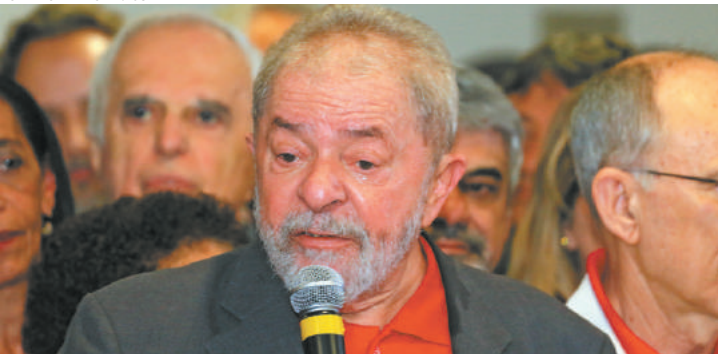
Na defensiva - Ex-presidente Lula disse que nunca pegou um real