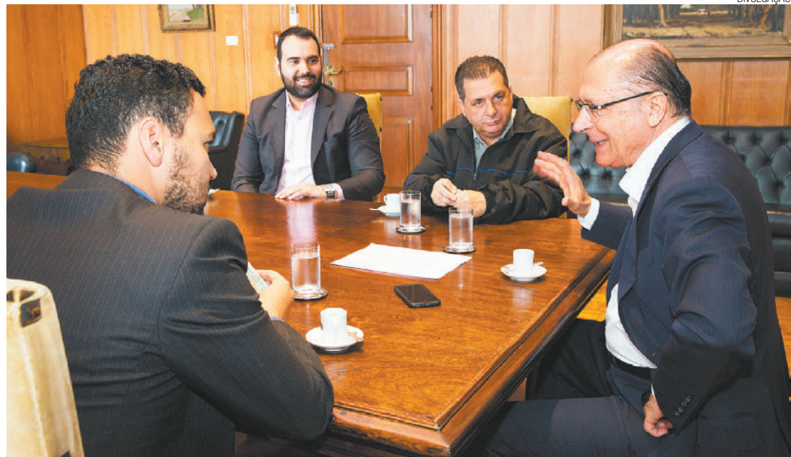
Mobilidade - Governador recebe equipe da FM para falar sobre diversos assuntos, dentre eles o transporte

O governador comentou ainda sobre a lei que pune empresas que vendem produtos roubados, sobre a crise hídrica, sustentabilidade e a fase final de testes da vacina contra a dengue.