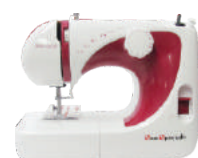
03 Máquinas de Costura Doméstica (para cada loja)