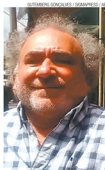
Perigo - Homem detido portava seringas e pode ter problemas mentais

seringas com o homem, que foi encaminhado para delegacia. O suspeito teria confessado os crimes, mas os agentes perceberam que o relato não tinha consistência. "Ele começava a falar, depois desconversava", diz Nico Gonçalves. "Ele falou que era uma brincadeira para assustar as pessoas." Para os investigadores, o homem tem problemas mentais, motivo pelo qual foi pedida internação do suspeito.