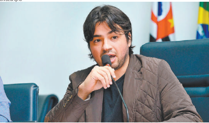
Proteção - Prefeiturável assinou termo de compromisso na tarde de ontem