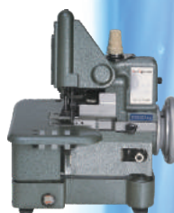
01 Overlock Semi Industrial (para cada loja)