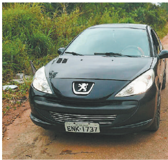
Violência - Acusados estariam procurando local para executar vítima asfixiada com fios (destaque acima)

O trio de suspeitos teria afirmado aos PMs que iriam "dar uma surra" na vítima. "Porém, após os policiais militares vistoriarem o veículo, foi encontrada uma carta, ordenando a morte da vítima. Havia também fios usados em instalações elétricas, que a vítima afirmou que seriam (usados) para executá-la mediante asfixia", informou a PM.