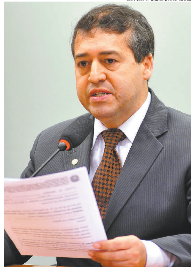
Adiado - Ronaldo Nogueira, ministro do Trabalho do governo Temer

Ministro já disse que reforma iria propor o aumento da jornada; depois voltou atrás