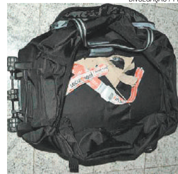
Tráfico - Estrangeiro transportava seis quilos de coca na bagagem

No outro caso, ocorrido durante o check-in de voo com destino a Abu Dhabi (Emirados Árabes), policiais que entrevistavam passageiros desconfiaram de um francês, de 50 anos, que havia chegado de viagem no dia anterior prove-