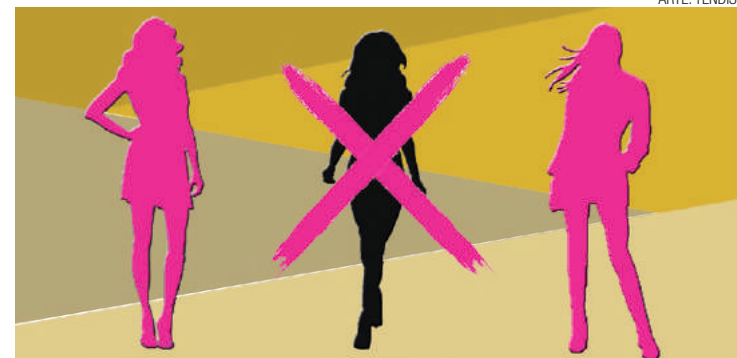
Machismo - Cerca de 30% dos entrevistados estão "contra" as vítimas