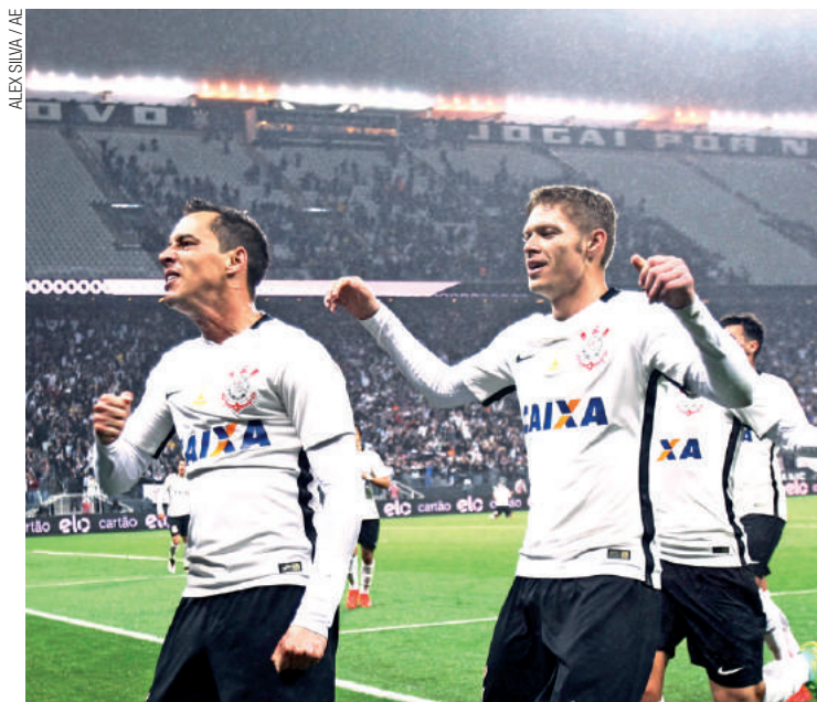
Redenção - Após derrota em clássico no sábado, Timão venceu Fluminense