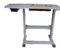
01 Mesa Familiar (para cada loja)