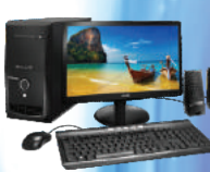
01 Computador (para cada loja)