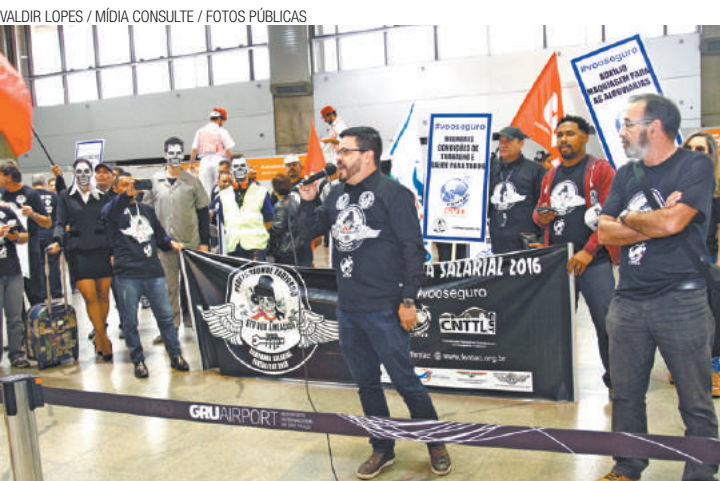
Protesto - Ato foi realizado no Aeroporto Internacional de Guarulhos

Os trabalhadores reivindicam reposição integral da inflação da data-base, 1º de dezembro, e mais 5% de ganho real, a garantia do nível de emprego nas bases da Fentac, bem como a manutenção dos direitos nas convenções coletivas de trabalho e a ampliação e melhorias nos direitos econômicos e sociais.