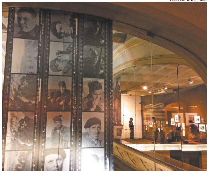
Imperdível - Originais de Robert Capa, Gerda Taro e David "Chim" Seymour

A Guerra Civil Espanhola reuniu elementos militares e ideológicos que caracterizariam o século XX, durou quase quatro anos, deixou 400 mil mortos, arrasou a economia do país e instaurou uma ditadura fascista que perdurou por