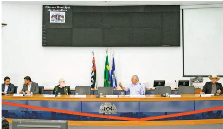
Ausência - Quatro candidatos faltaram no primeiro debate na Câmara