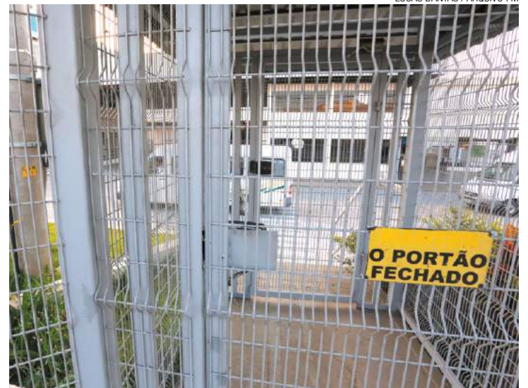
Randon - Empresa encerrou atividades industriais no município em abril