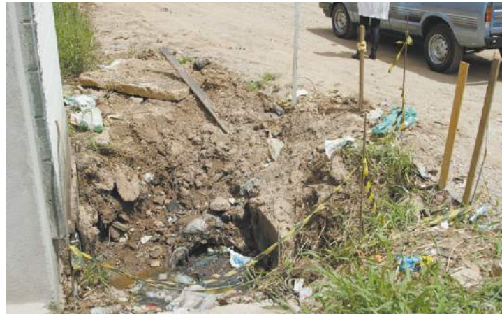
Precário - Saae suspeita de esgoto clandestino e promete averiguar