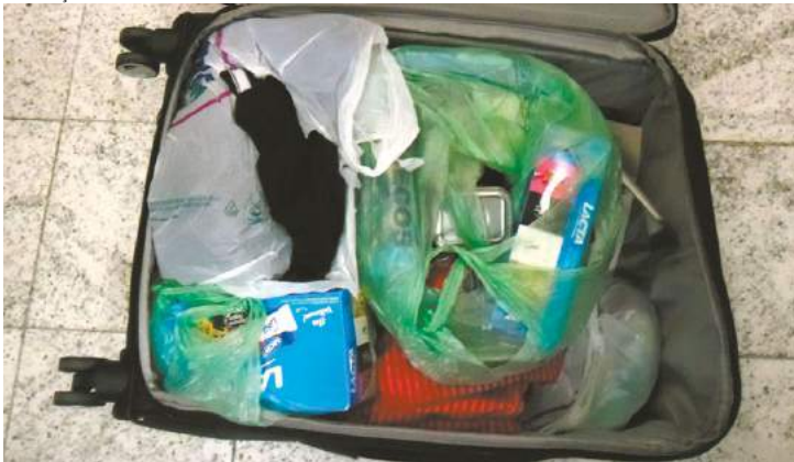
Trapaça - Entorpecentes estavam escondidos em "malas diplomáticas"