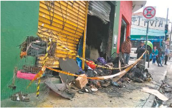
Prejuízo - Fogo destruiu loja de bolsas e acessórios na Timóteo Penteado