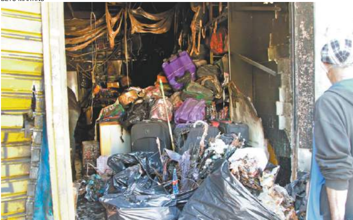
Estrago - Produtos queimados ficaram expostos na frente do imóvel