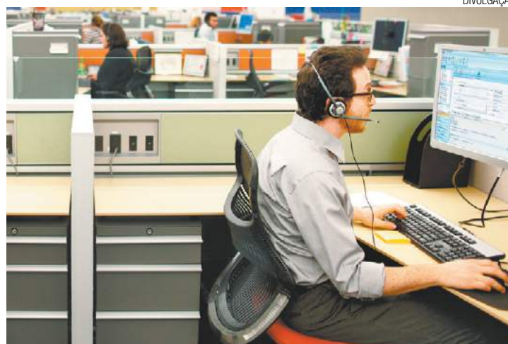
Trabalho - Companhia registrou aumento de R$ 60 mi na receita bruta