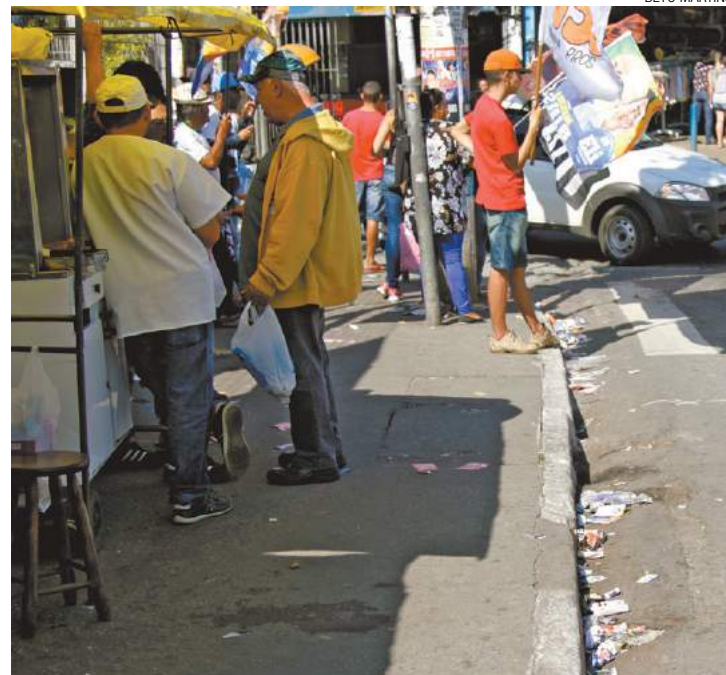
Bandeiradas - Esquinas dos comércios estão tomadas por colaboradores