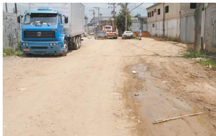
Poeira - Falta de pavimentação é problema antigo, reclamam moradores

Em dias de chuva, vizinhos não conseguem sair