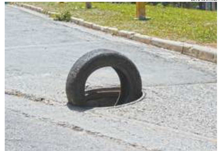
Precaução - Pneu foi colocado no local do problema para evitar acidentes