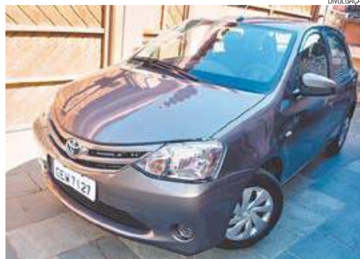
Conforto - Transmissão automática privilegia a dirigibilidade e desempenho