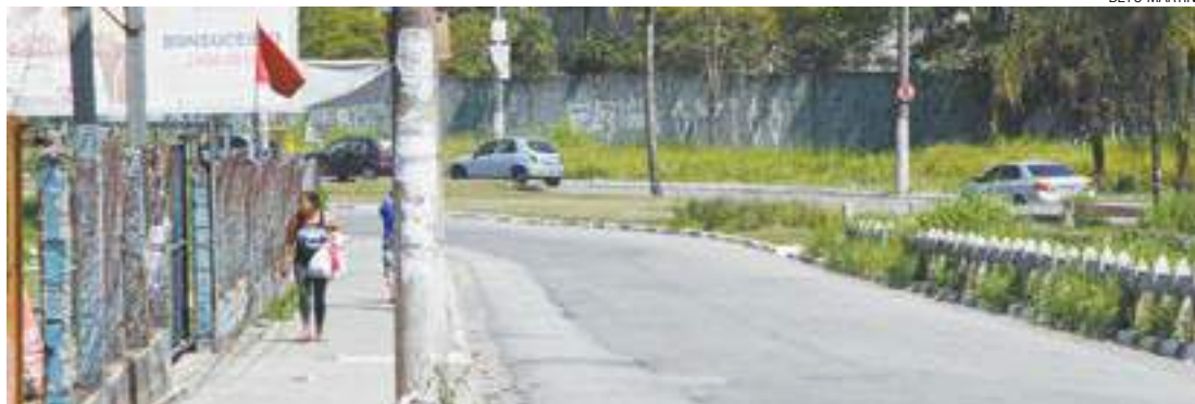
Trecho perigoso - Avenida Jurema (foto) e Estrada da Água Chata são as vias com maior risco de roubos

O Departamento de Iluminação da Prefeitura afirmou que os pontos de iluminação situados na via estão funcionando normalmente. A Pasta explicou que a região da Vila Dinamarca está passando por manutenção e todos os pontos que apresentarem problemas vão passar por reparos.