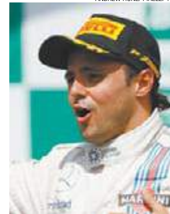
Massa - Está com temor de que Brasil fique sem a corrida

ESTADÃO CONTEÚDO - Um dia depois de a Federação Internacional de Automobilismo (FIA) divulgar o calendário provisório da temporada de 2017 listando o GP do Brasil como uma prova ainda sujeita a confirmação, Felipe Massa admitiu ontem, em Sepang, na Malásia, que teme pela saída da prova brasileira do Mundial.