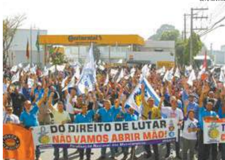
Mais de 20 - Empresas do Itapegica e Cumbica participaram do protesto