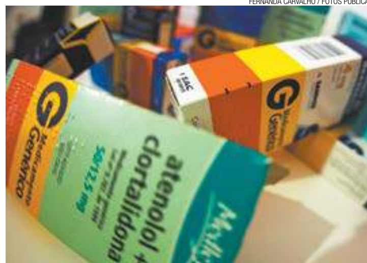
Campeão - São Paulo é o Estado com maior índice de processos do tipo