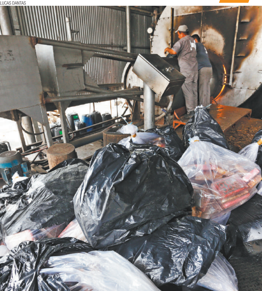
Virou pó - Carga de cocaína, avaliada em R$ 20 milhões, foi queimada pela Polícia Civil