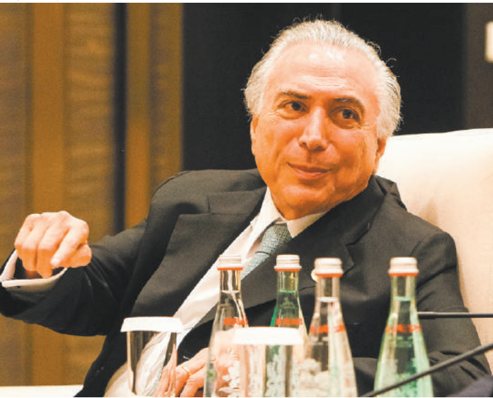
Retorno - Temer exercerá o comando definitivo do País a partir de hoje