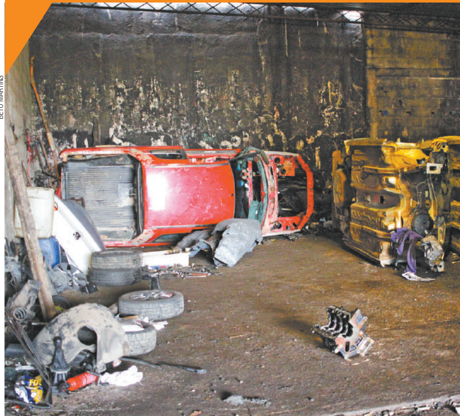
No Bausucesso - Carros eram retalhados e as peças comercializadas no mercado ilegal