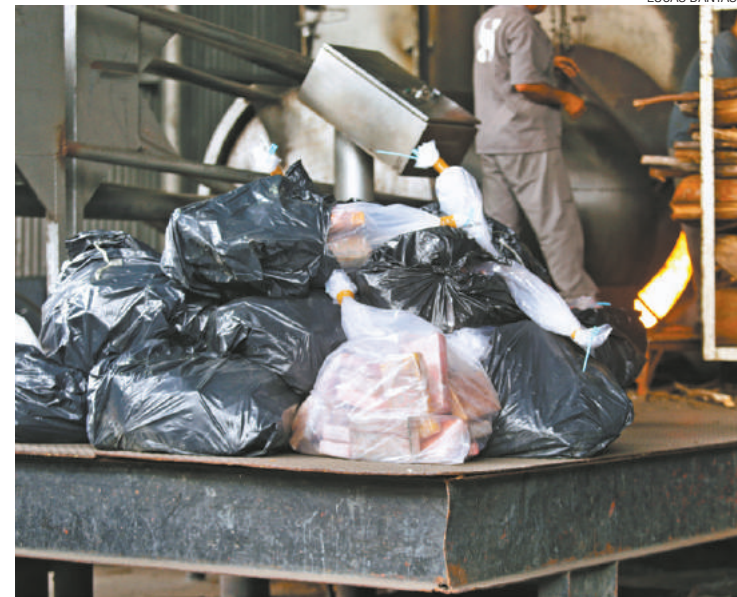
'Prejuízo' - Uma tonelada da droga virou cinzas em forno de empresa

Droga estava dentro de galpão nos Pimentas