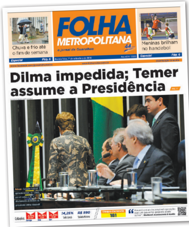
História - Folha Metropolitana registra principais acontecimentos do País

Nestes 45 anos, a FM trouxe aos guarulhenses informações essenciais da cidade, do Estado, do País e do Mundo. Uma história que atua como