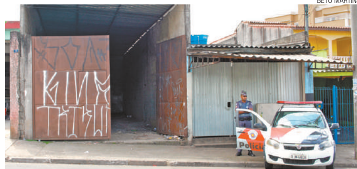
Rotina - Vaivém de veículos chamou atenção e PM foi acionada

Motos da Rocam foram verificadas e, após policiais entra-